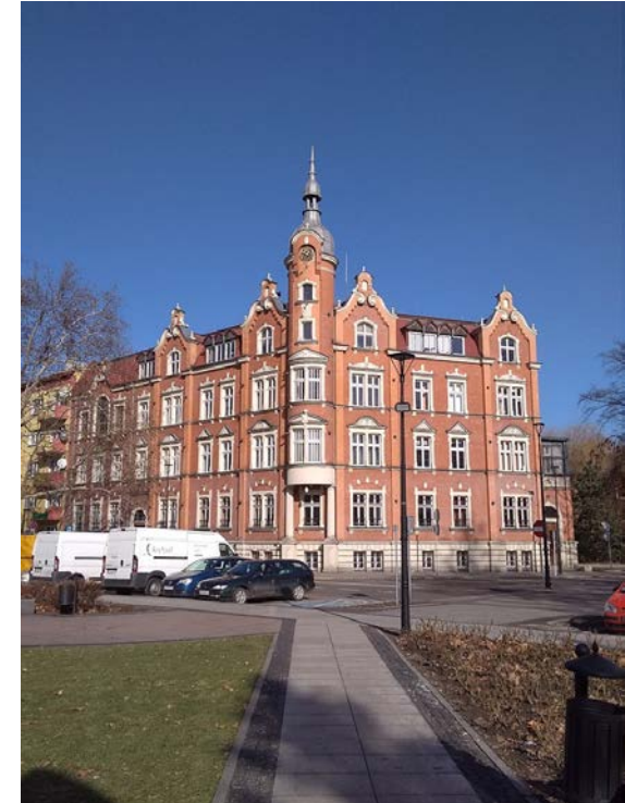
POLONIA (Semianowice Slaskie)