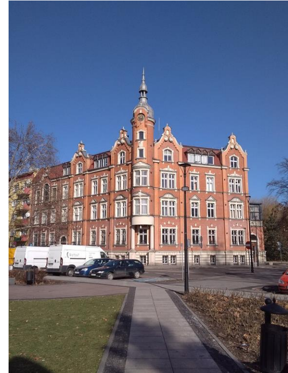
POLONIA (Semianowice Slaskie)