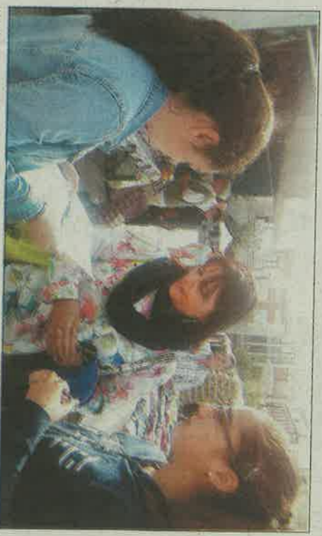
Las encuestas las han llevado a cabo los propios alumnos.

Una vez los docentes portugueses, griegos y franceses conocen de primera mano la situación del complejo y de la zona, solo quedará esperar la llegada de los alumnos, que realizarán actividades relacionadas con el espacio natural.