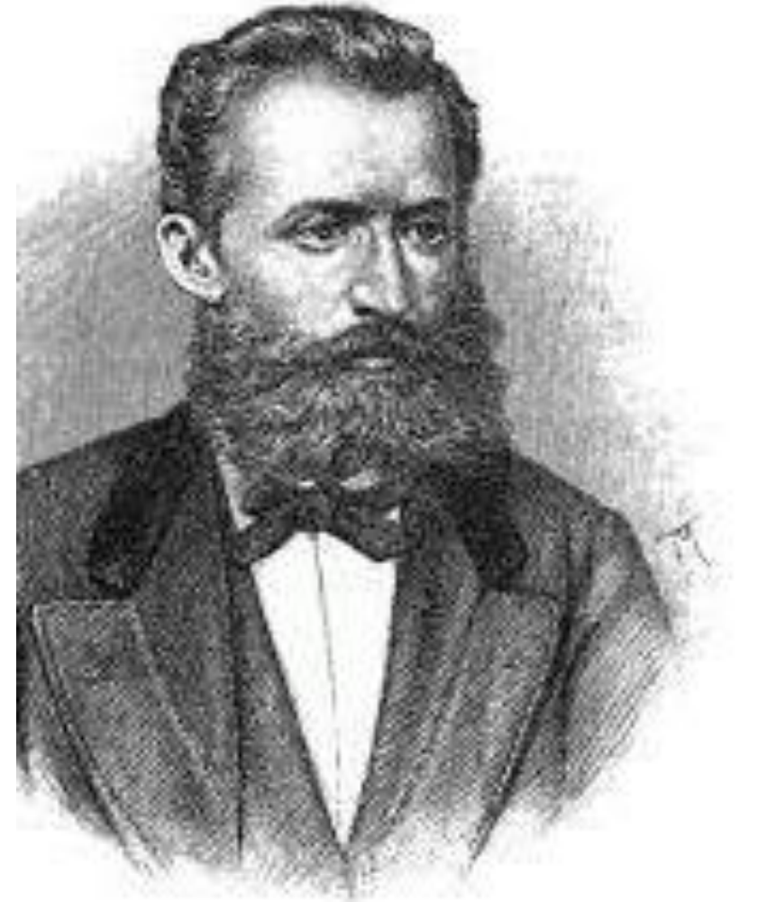
Slika preuzeta ovdje .