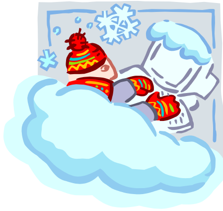
Resmi veya grafiği açıklayan alt yazı.

Yeterli alan varsa, buraya küçük bir resim veya başka bir grafik eklenebilir.