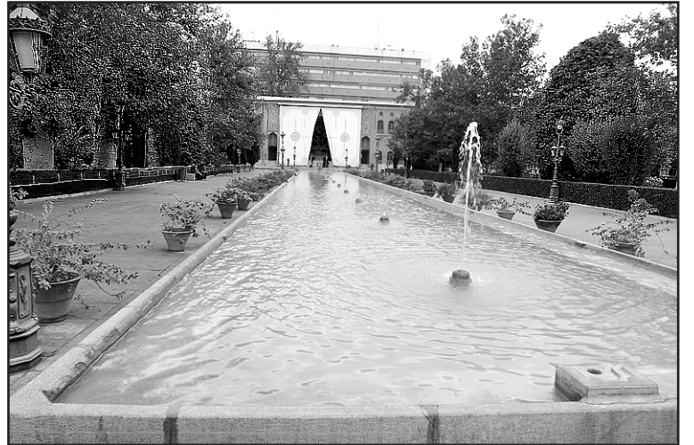
Rožių rūmų kiemelis Teherane