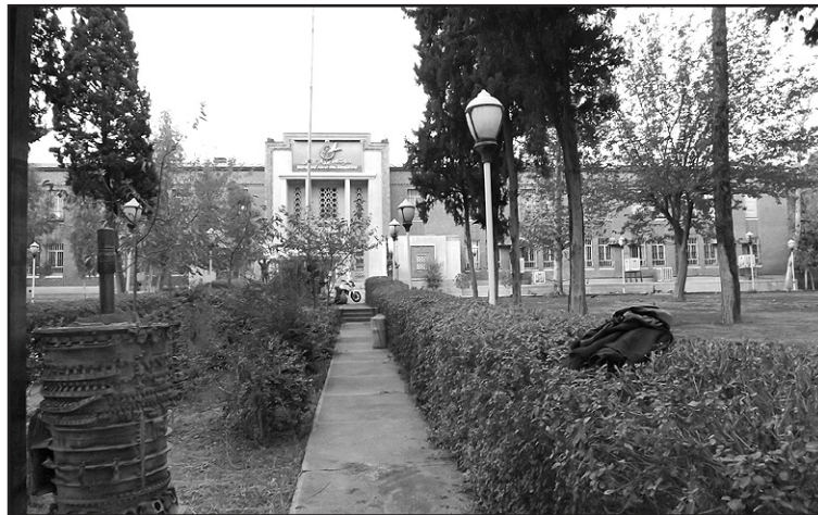
Į Amerikos ambasadą – pro vartų plyšį