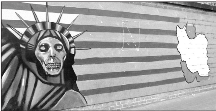
Antiamerikietiška ambasados tvoros „puošyba“

visus dykumos skorpionus ir sumetė į miestą, bet ir tai nepadėjo. Šiame mieste grožimės ir Saliomono šaltiniu, o jis, pasirodo, labai nuodingas, jo vandenyje labai didelė gyvsidabrio koncentracija.