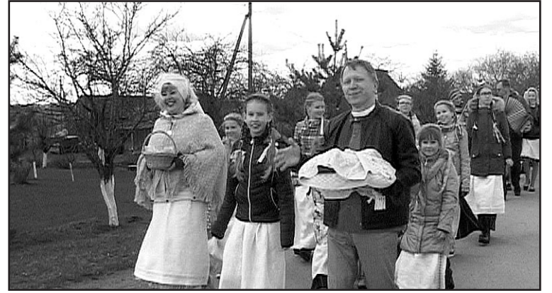
Iš bažnytelės į šventę