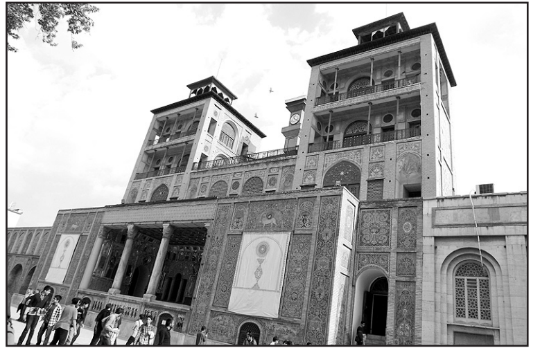
Golestano rūmai Teherane