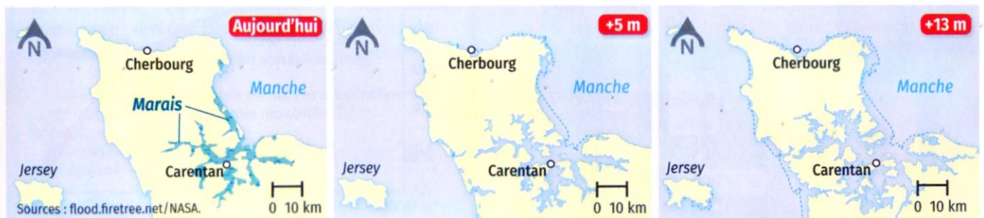
Cartes des terres émergées du département de la Manche en fonction de la montée du niveau marin.

L'élévation du niveau de la mer a été estimée en fonction de différents scénarios du GIEC. Avec le RCP 4.5, on estime l'élévation à 0,32 m en 2010 et à 5 m en 2500 par rapport au début du XXI e siècle. Avec le RCP 8.5, elle est estimée à 1 m en 2100 et à 13 m en 2500.