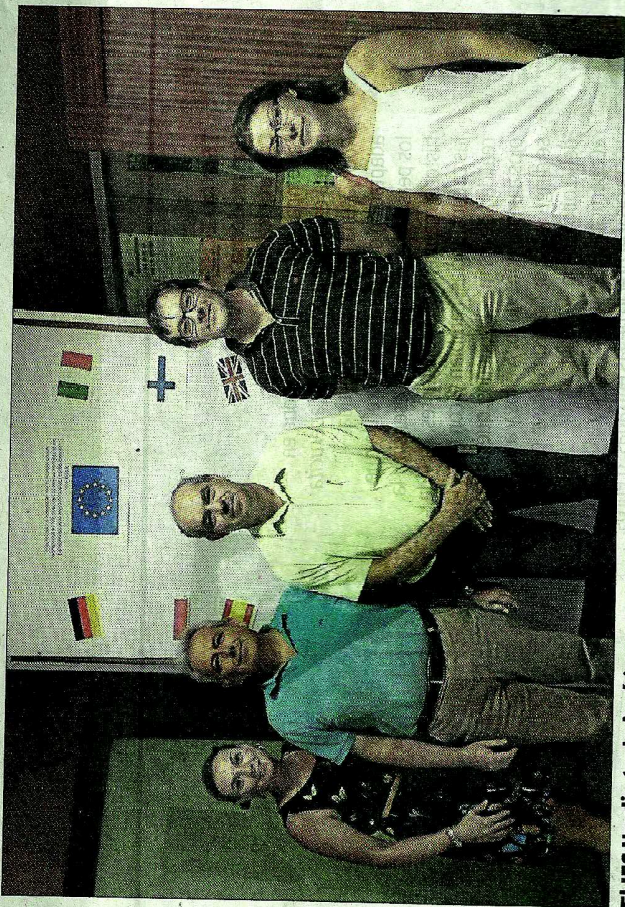
El IES Huelin trabajará junto a centros de otras cinco ciudades europeas. L. O.

El proyecto tiene tres temas principales, siendo el primero sobre la mejora del proceso de enseñanza-aprendizaje: recursos educativos abiertos, métodos innovadores de enseñanza basados en problema o proyecto, mejora de los resultados especialmente de los alumnos con discapacidades o dificultades de aprendizaje o dinamización de la biblioteca escolar. El segundo tema versará sobre energías renovables, eficiencia energética, cambio climático, reducción de CO2 o gestión de residuos. Por último, en la tercera parte se tratará el fomento del espíritu empresarial con la creación de una mini empresa. El proyecto usará la plataforma europea de trabajo colaborativo «eTwinning».