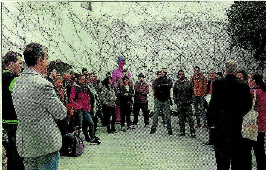
El grupo formado por malagueños y alemanes en el Museo Jorge Rando.