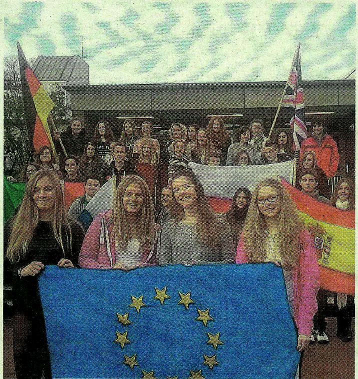
Students from six countries met up in Germany.