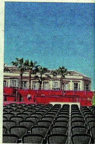
Imagen de la tribuna oficial

Como parte del tema de energía renovable el grupo visitó el jueves la estratégica central hidroeléctrica del Tajo de la Encantada en El Chorro, el parque eólico de Sierra de Aguas en Carratraca y el Parque Natural Torcal de Antequera. En las dos primeras visitas, tanto alumnos como profesores pudieron profundizar en sus conocimientos con las explicaciones de los ingenieros de ambas centrales de energía renovable. Y ayer visitaron los diferentes espacios de Promálaga UrbanLab, destinado a la innovación urbana y al desarrollo de ideas y proyectos tecnológicos avanzados.