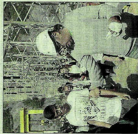
Visita a la central del Chorro. L. O.