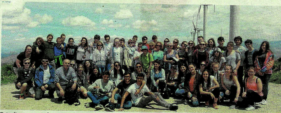
Estudiantes y profesores, en el parque eólico de Carratraca. :: SUR

La Agrupación, que se siente perjudicada, intentará llegar a un acuerdo satisfactorio con la empresa a través de la negociación. El principal problema es que la visibilidad desde muchos palcos era mala o nula. Si la negociación no fructifica, la Agrupación recurrirá a la vía judicial para defender sus derechos. Los abonados que vieron lesionados sus intereses serán compensados y el año próximo pagarán la mitad del importe de sus localidades. «La Agru-