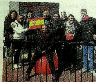
Marbella students in Kells. :: SUR

Their Erasmus project, "Teaching: An effective key to self-learning", encourages students to act as teachers at the foreign schools they visit. The Marbella students focused their session in Ireland on traditional Andalusian games.