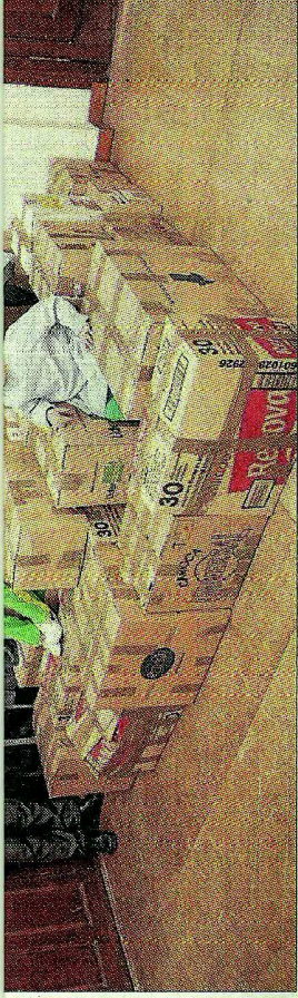
Un grupo de alumnos posa junto a las cajas con los alimentos recogidos. L.O.

Los alumnos de Secundaria son los encargados de seleccionar, distribuir y empaquetar las cajas que se aportan des-