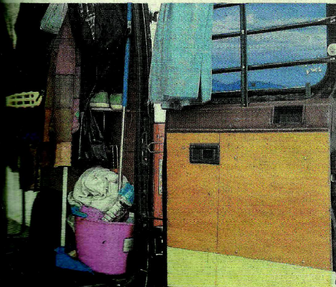
involved in Britain's Got Talent and marathons. :: SUR

who has won several awards for his guitar-playing, continues to build a name for himself in Spain and Holland