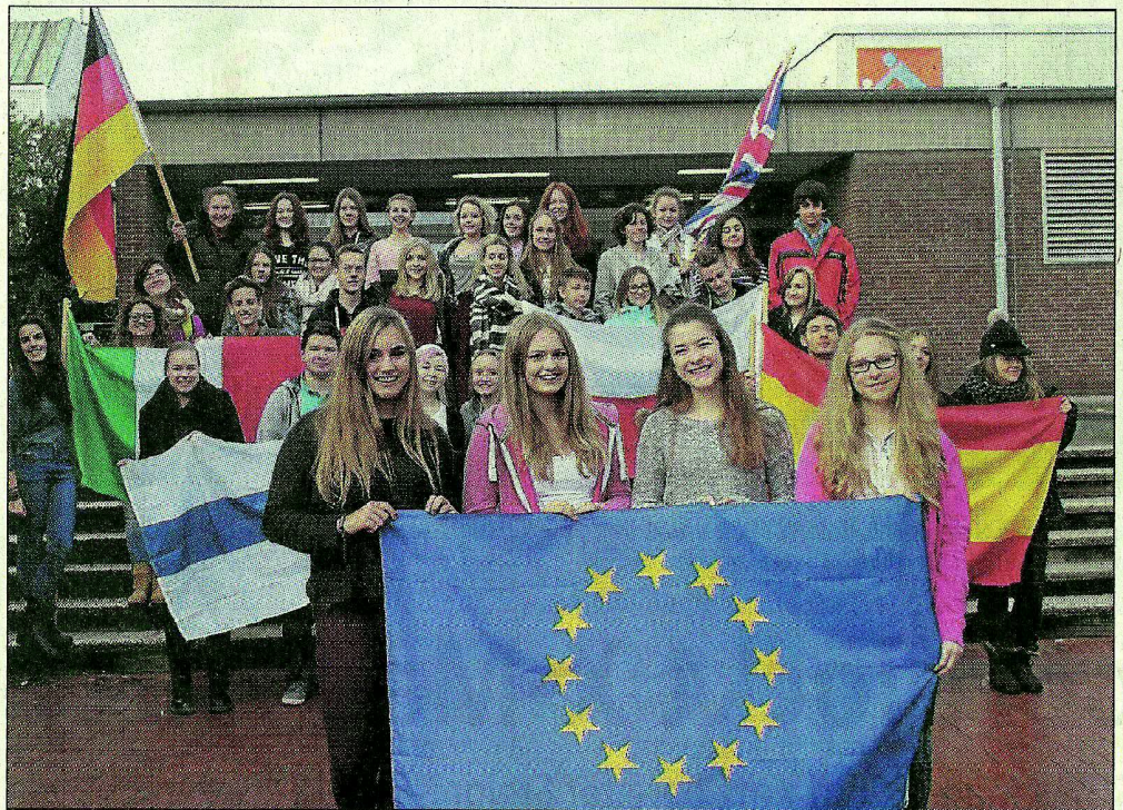
Jugendliche aus sechs Nationen – Achimer inklusive – und deren Lehrer halten ihre jeweiligen Landesflaggen und die Europa-Flagge als vereinesendes Symbol hoch.