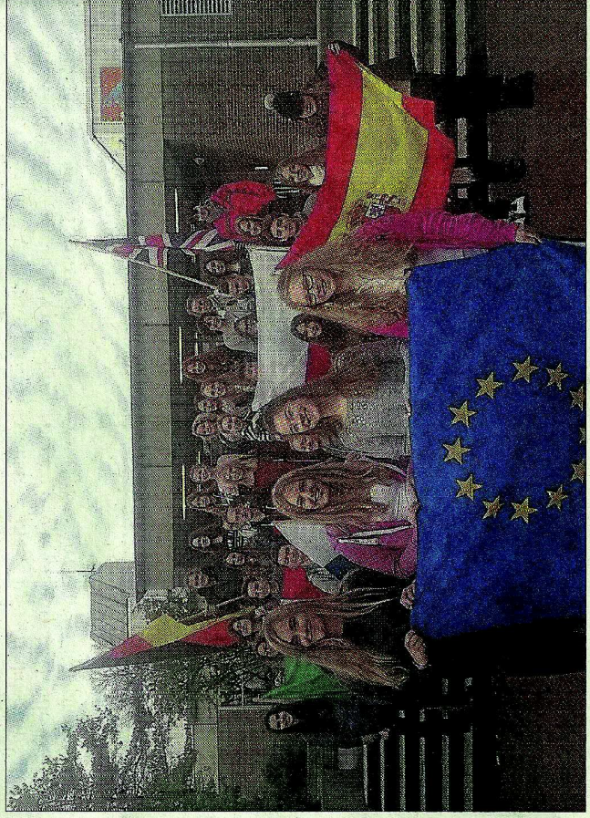
Cuatro estudiantes y dos profesores del IES Huelin han viajado a Achim. L.O.

explicaron en varias clases el tema del reciclaje y asistieron junto a otros estudiantes a cuatro charlas impartidas por Zencer, la única cooperativa andaluza que provee energía limpia 100%, con sede en Fuengirola. En la primera de las actividades, los alumnos mostraron dos vídeos, sobre cambio climático y reciclaje, y expusieron algunas ideas sobre cómo se debe reciclar tanto en casa como en el centro, ya que se van a colocar contenedores en el instituto para mejorar la gestión de los residuos. Por otra parte, numerosos alumnos formarán parte de la Patrulla Verde que el IES Huelin va a organizar junto a un concurso para premiar a las clases más limpias, ecológicas y silenciosas. En la segunda de las actividades las charlas trataron sobre el consumo eléctrico responsable.