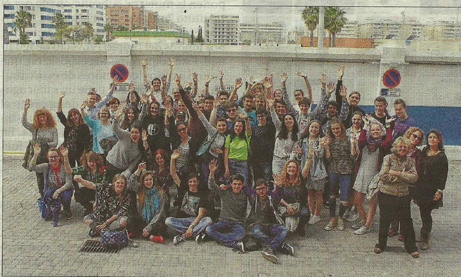
Los alumnos malagueños y del resto de centros durante una de las actividades. L. O.

En esta experiencia, en la que se utiliza el inglés como idioma común, los alumnos locales y los visitantes trabajaron juntos en actividades sobre Diversidad, Sostenibilidad y Emprendimiento. Los primeros días, alumnos y profesores llevaron a cabo reuniones, observaciones de clases, charlas y talleres relacionados con la diversidad, la disciplina y el absentismo en la escuela; el Banco del Tiempo y cómo implementarlo en la escuela. Además, cada centro expuso el plan de producción, estatutos y gestiones administrativas de su empresa, ya que uno de los te-