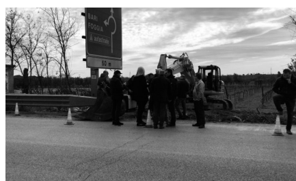
Giovedì mattina è arrivata una ruspa sui terreni del Pavoncelli di Cerignola