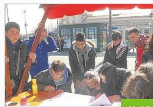
Numero 1, anno 2016/2017

El IES Trassierra ha participado en el segundo de los encuentros internacionales programados dentro del proyecto Erasmus+ European Active Citizenship. El encuentro se ha celebrado en Zagreb, capital de Croacia.