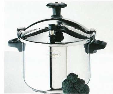
Doc 1 Au premier plan, sur le couvercle, on voit la soupape.