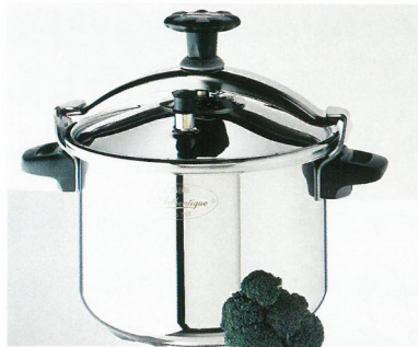
Doc 1 Au premier plan, sur le couvercle, on voit la soupape.