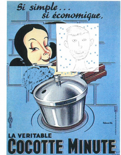
Doc 2 Publicité parue en 1952 : faire des économies d'énergie, c'est aussi faire des économies financières.

▶ L'utilisation d'un autocuiseur, qui diminue le temps de cuisson, entraîne une économie d'énergie.