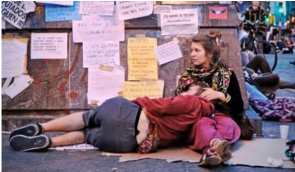
Imagen 5 6

Más tarde, el 22 de marzo de 2014, decenas de miles de personas llegaron a Madrid desde toda España para las Marchas de la Dignidad con el objetivo de exigir una solución para los seis millones de desempleados y el fin de los recortes económicos, además de culpar a los políticos y banqueros, considerados como los responsables de la crítica situación que atravesaba el país. También exigieron el derecho a una vivienda digna y a un sistema educativo y sanitario de calidad. Según las formas de organización descentralizada dentro del ámbito de los movimientos sociales no institucionalizados que caracterizaron las protestas del movimiento 15-M en 2011, no hubo líderes ni portavoces. El manifiesto de las Marchas de la Dignidad explica su protesta: