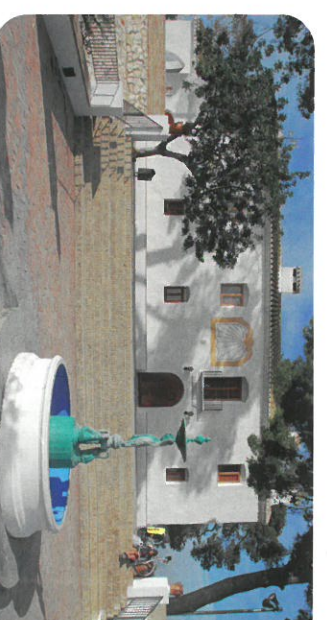
Muntanyeta dels Sants

Portet de Silla: Pequeño puerto pesquero de l'Albufera. La Cofradía de Pescadores de Silla es junto a la de Catarroja y El Palmar, una de las que tienen el derecho a pescar en l'Albufera.