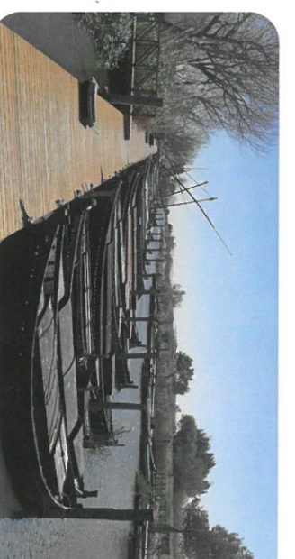
Port de Catarroja