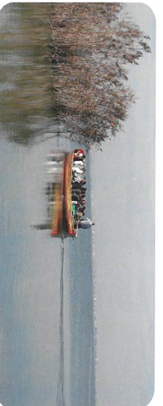
Navegació per l'Albufera