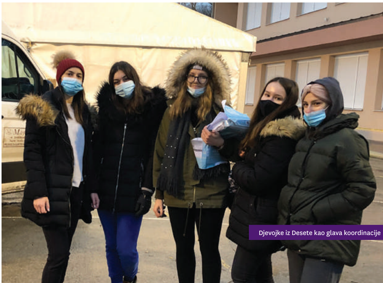
Djevojke iz Desete kao glava koordinacije

Nikada nisam imala tako naporne, a tako ispunjene praznike. Stalno sam u kontaktu s ljudima koji su još u Gori i radim sve što je u mojoj moći da se ne zaboravi. Nadam se da će ovaj tekst motivirati mnoge na humanitarni rad jer znam da je meni ovo bilo predivno iskustvo koje ću pamtit i cijeli život.