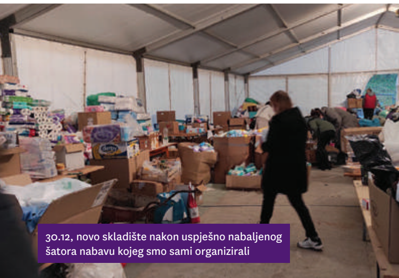
30.12, novo skladište nakon uspješno nabavljenog šatora nabavu kojeg smo sami organizirali