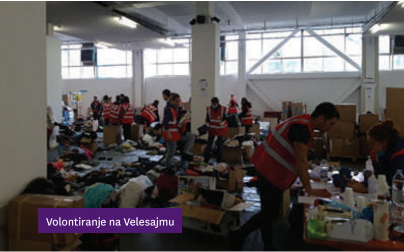
Volontiranje na Velesajmu