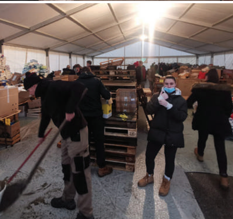
Kaos u skladištu prije Marijinog pokretanja akcije