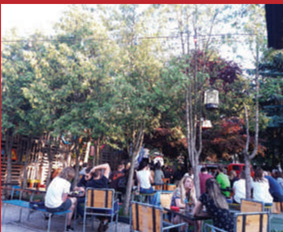
Predstavljanje knjige Sve bio je ritam u Vintage industrial baru

Jedna od najvažnijih osoba novog vala, glazbenog pravca s početka 80-ih, bubnjar i pjevač, a po obrazovanju akademski kipar, objavio je autobiografiju Sve bio je ritam. Sve počinje 1978. kada Boris, tadašnji student grafičkog dizajna, odlučuje pristupiti Azri, koju vodi Branimir Štulić. Azra ubrzo doživljava ogromnu slavu i uspjeh, a Borisov život credo ubrzo postaje sex, drugs and rock&roll. Azra je Borisa definirala, ali život na vrhuncu ostavlja svoje posljedice. Nakon ne tako laganog raspada Azre, Boris je u potrazi za nečim novim i unikatnim. Povezuje se sa Srđanom Sacherom, basistom i kompozitorom grupe Haustor s kojim počinje eksperimentirati. Pridružuje im se i Mladen Juričić, zvani Max, te nakon godine dana pokusa u Borisovoj garaži osnivaju Vještice, bend totalno drukčijih od drugih. Leiner zaboravlja na Azru i ponovno pronalazi sebe. Boris Leiner je danas vrlo cijenjen kipar i slikar velikog talenta. Knjiga Sve bio je ritam svojom jednostavnošću na najbolji mogući način opisuje Borisov život. Kronološki ga prati opisujući svakakve zgode od Borisovog djetinjstva pa to kraja profesionalne glazbene karijere. Cenzura je minimalna, a zajedno s ilustracijama Davora Schunkea knjiga postaje nešto više od autobiografije. Ako želite iskusiti sex, drugs and rock&rolla Boris će vam otvoriti portal bar na nekoliko dana.