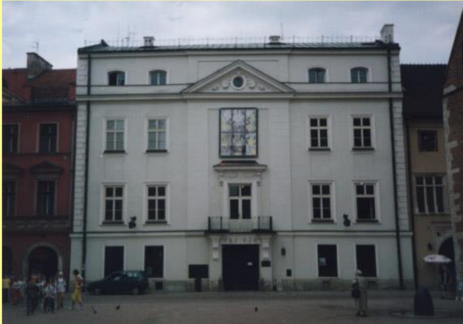
Wyspiański - Museum

Regional Museum des Modernismus in der polnischen Literatur „Rydlówka”