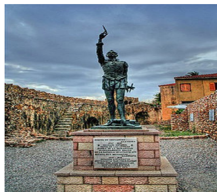
Άγαλμα του Μιγκέλ ντε Θερβάντες