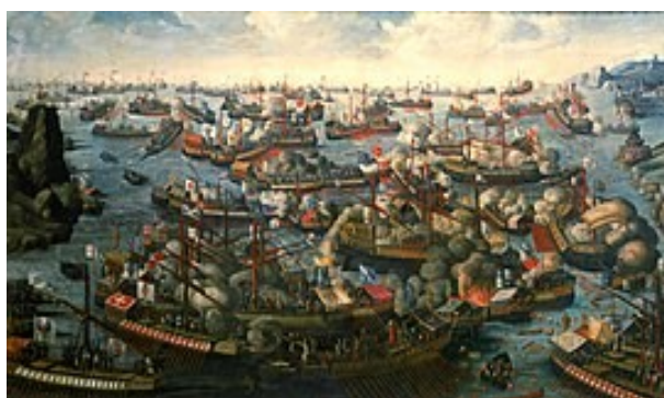
Η Ναυμαχία της Ναυπάκτου, αγνώστου καλλιτέχνη, Ναυτικό Μουσείο του Γκρίνουϊτς, (Λονδίνο).