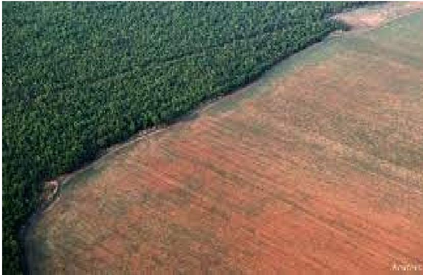
Η αποδάσωση του Αμαζονίου