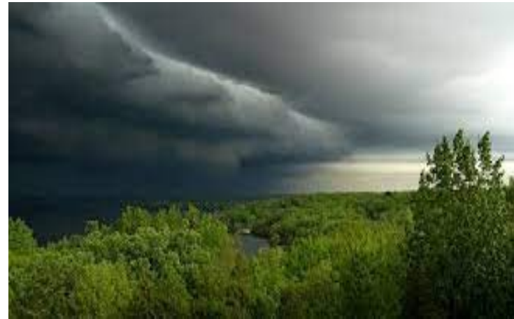
Πριν την όξινη βροχή