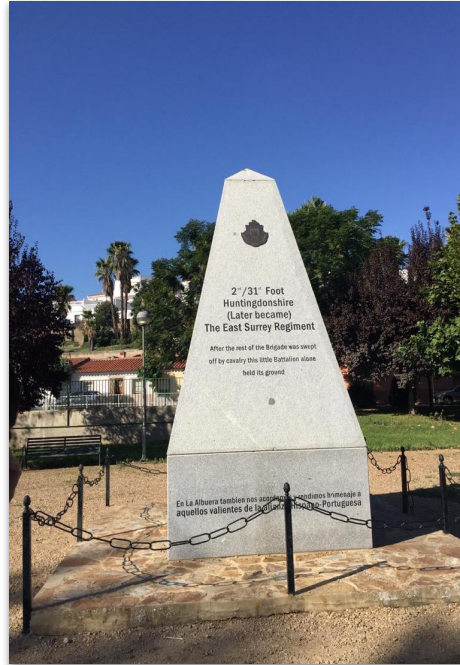
Estatua de Homenaje