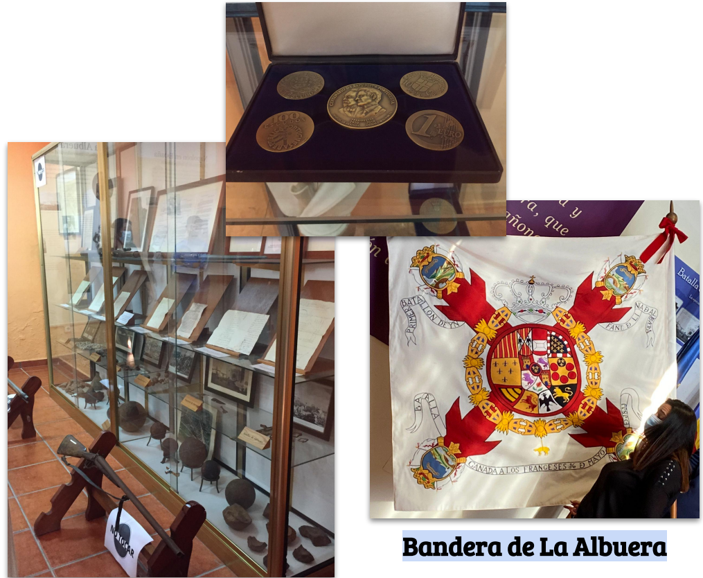
Bandera de La Albuera