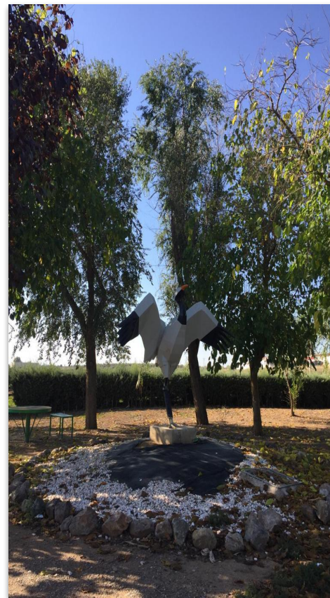
Estatua de una Cigüeña