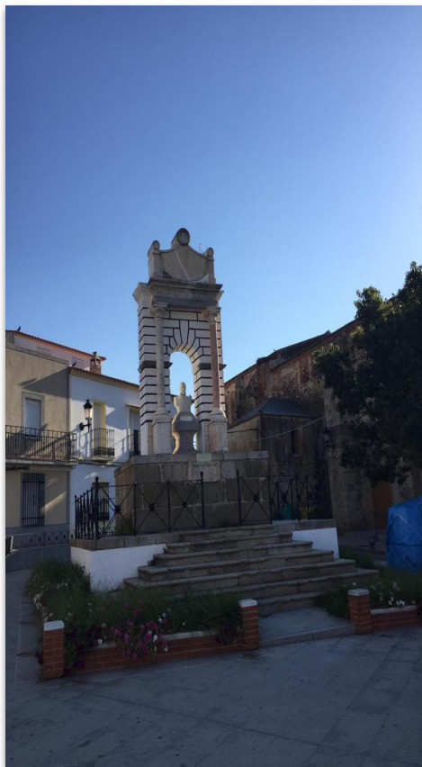
Plaza La Albuera