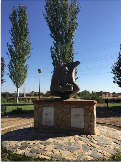
Estatua de Hans Christian Andersen