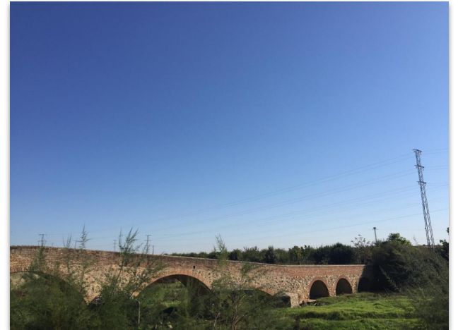
Puente de La Albuera