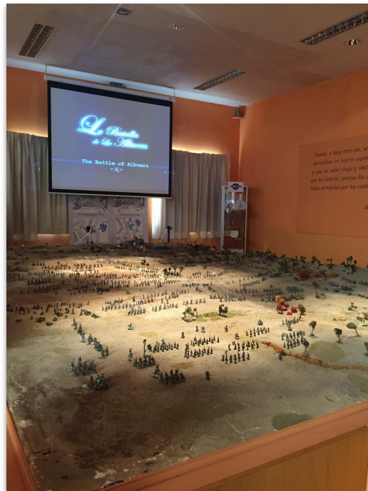
Maqueta de la batalla de La Albuera