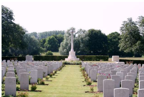
Figure 3: Cimetière britannique de La Vacquerie

Par ailleurs, l'omniprésence des cimetières militaires et des mémoriaux sont autant de marqueurs de la violence de la bataille.