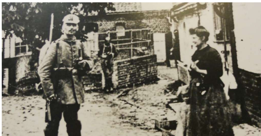
A Moeuvres pendant la Bataille de Cambrai

Proposée par le service Ville d'art et d'histoire de la Ville de Cambrai en partenariat avec la Médiathèque d'agglomération de Cambrai Scénographie : Yannick Prangère, graphiste indépendant