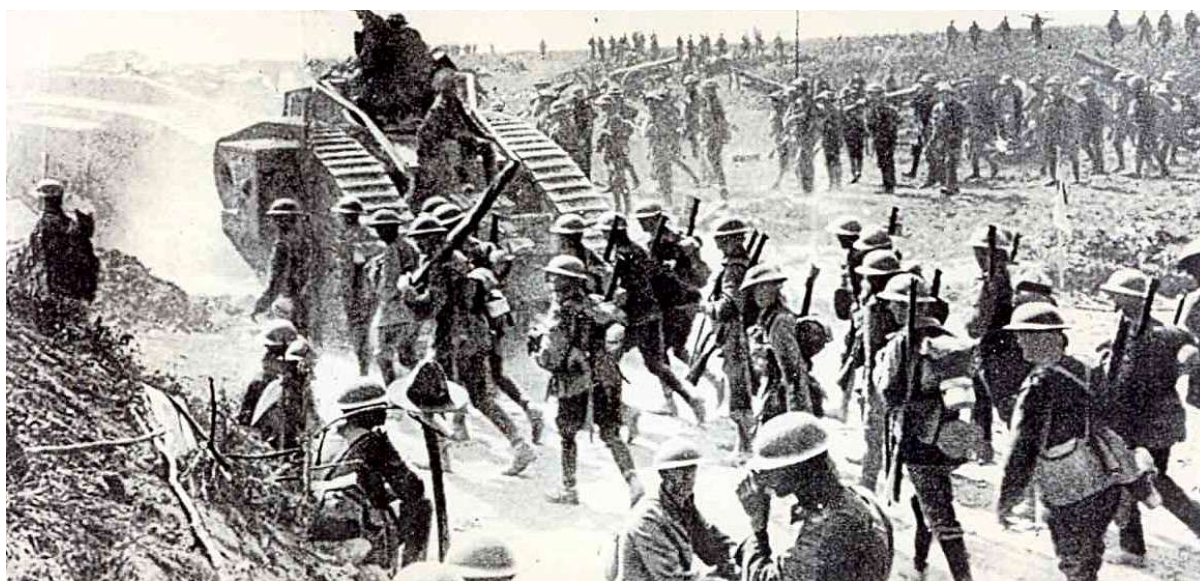
Figure 1: Avancée des Alliés

Diane Ducamp – chargée d'action culturelle 03 27 82 93 88 – dducamp@mairie-cambrai.fr