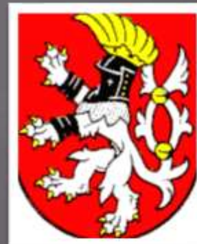
ÚSTÍ NAD LABEM