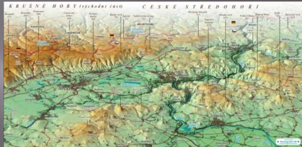
Mapa Českého Středohoří

Ještěd v Liberci je tam hotel, Restaurace a vyhlídka