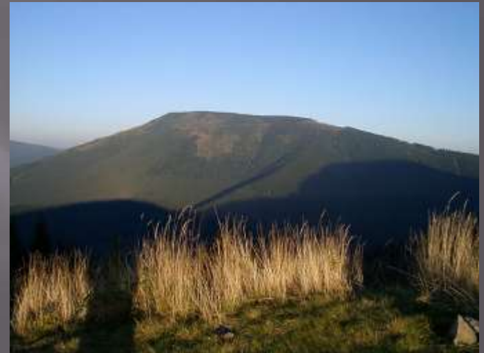
Jizerské hory- Smrk