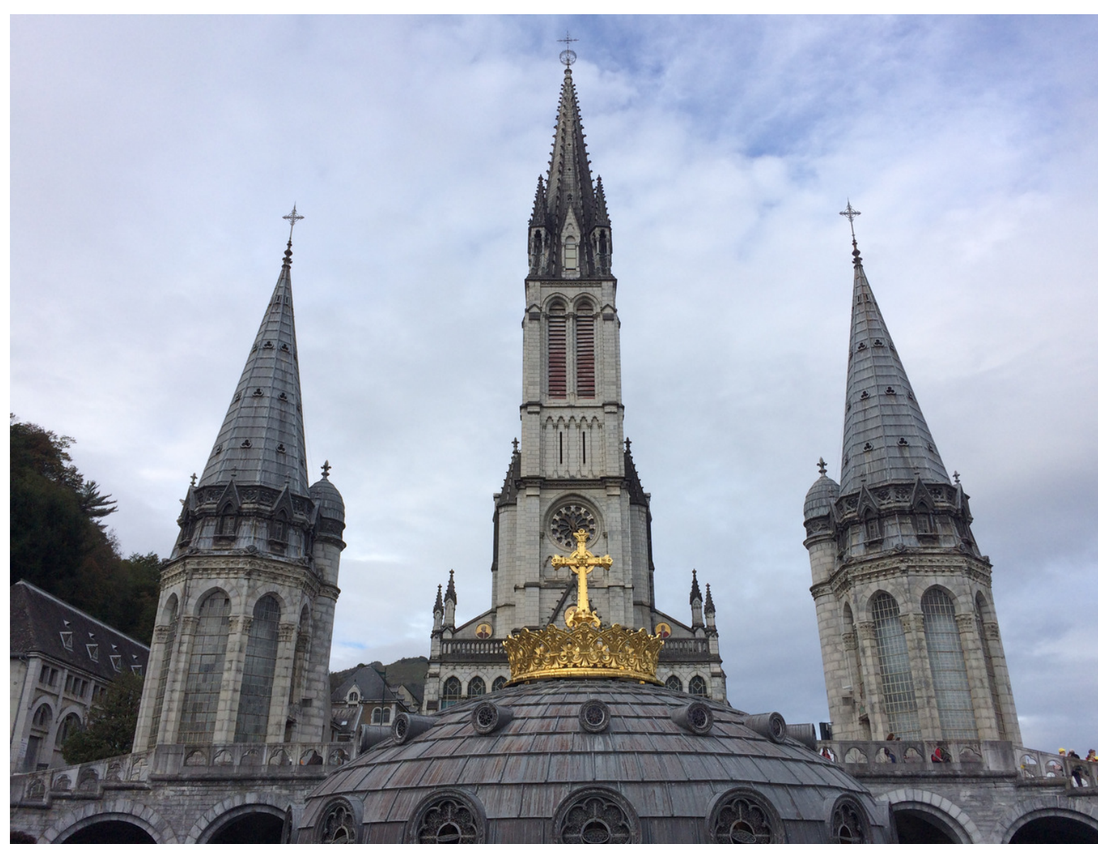
Santuário de Nossa Senhora de Lourdes