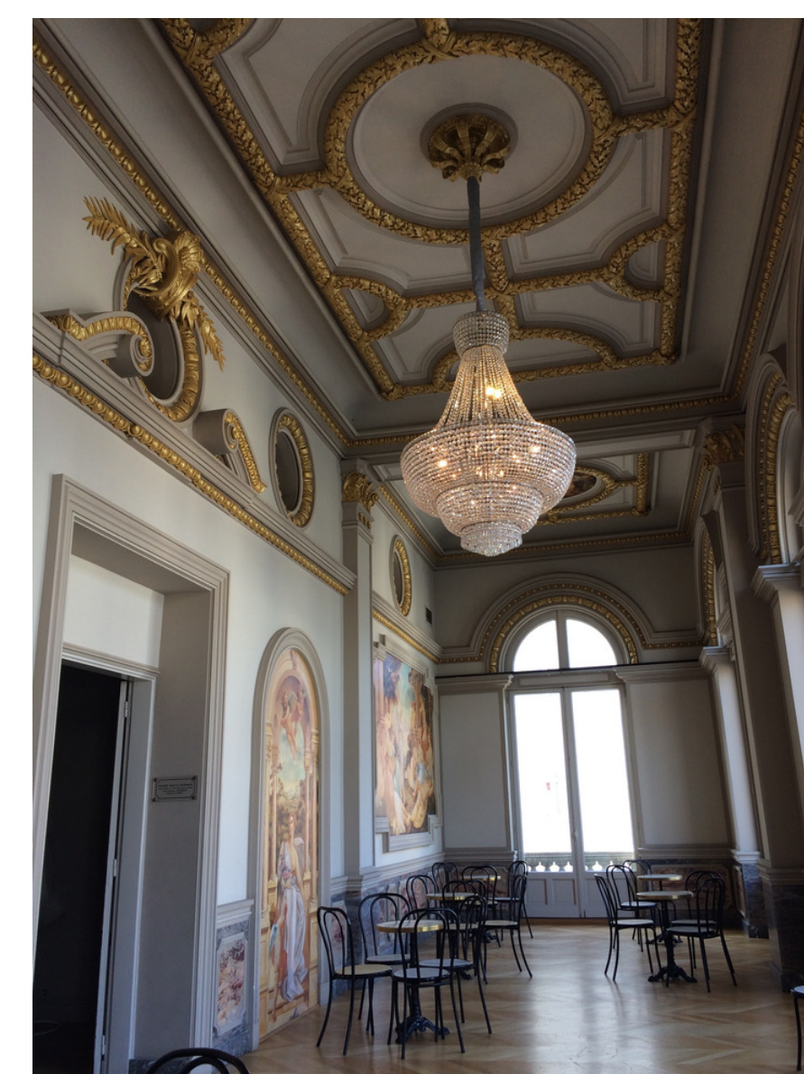
Teatro Municipal - Les Nouveautés