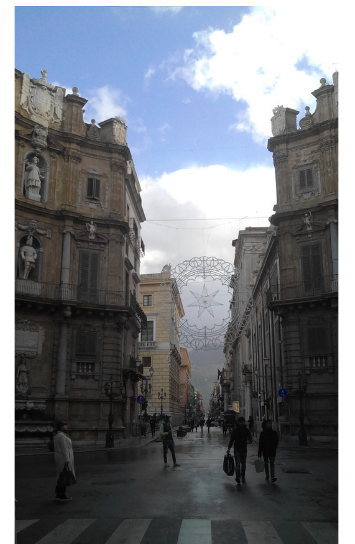
Quattro Canti di Palermo