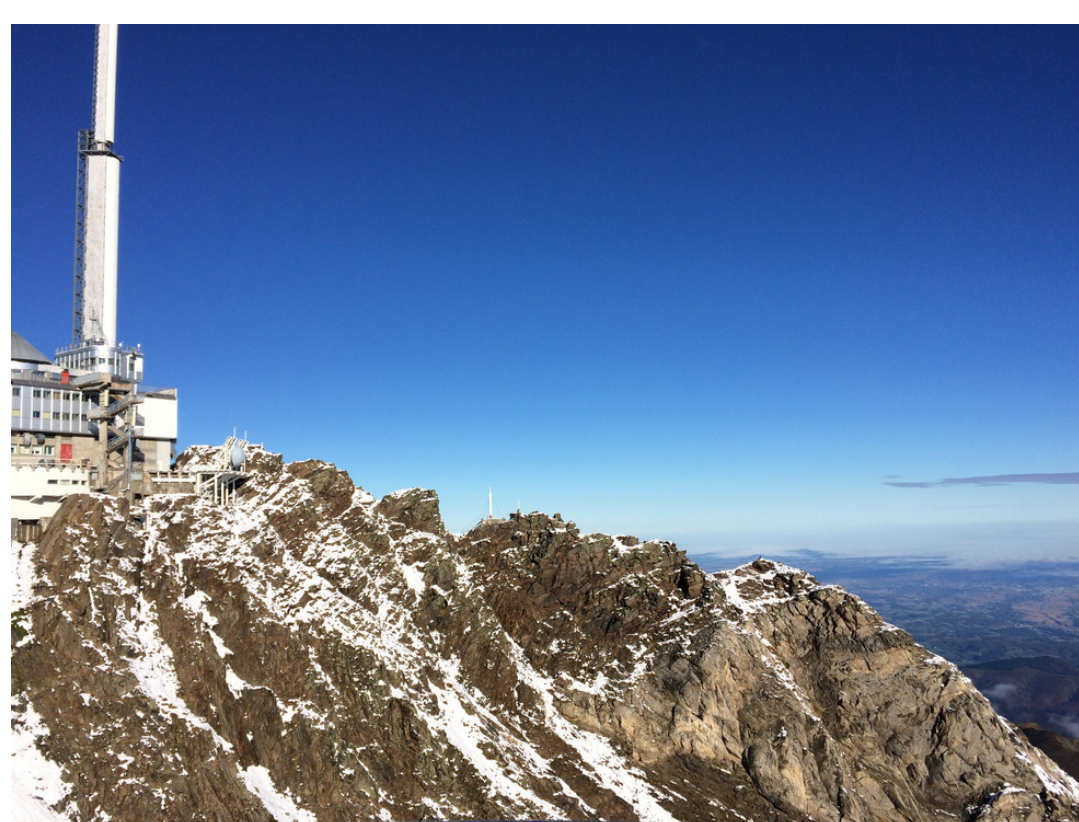
Pic du Midi, Pirinéus franceses

Visitámos os mais diversos locais, tanto com as nossas hosts families , como outras cidades que faziam parte do programa do projeto.