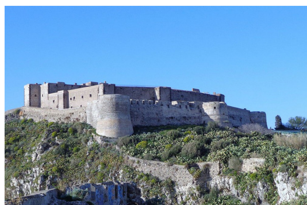
Castelo de Milazzo