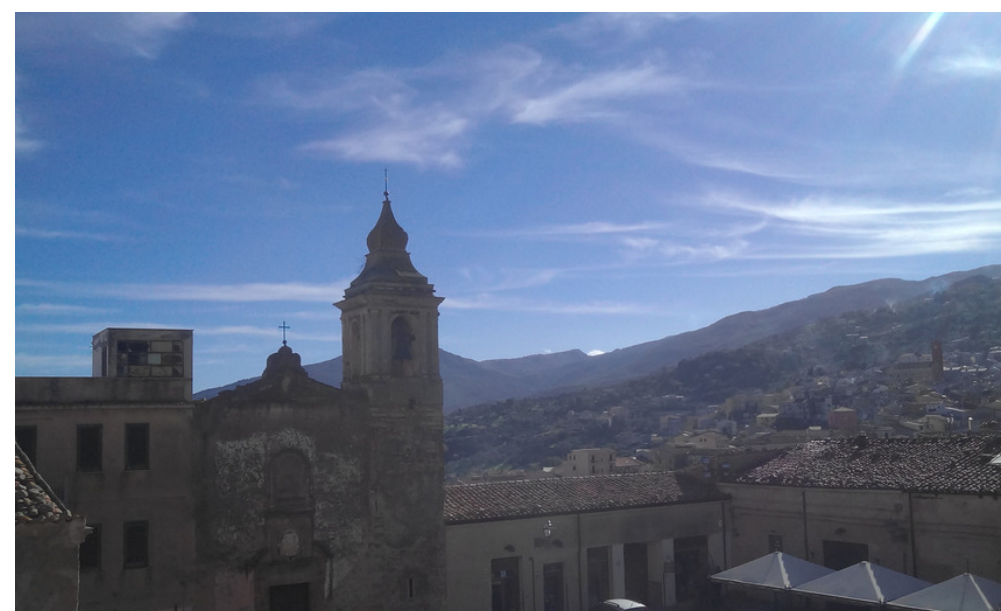
Castelo de Castelbuono