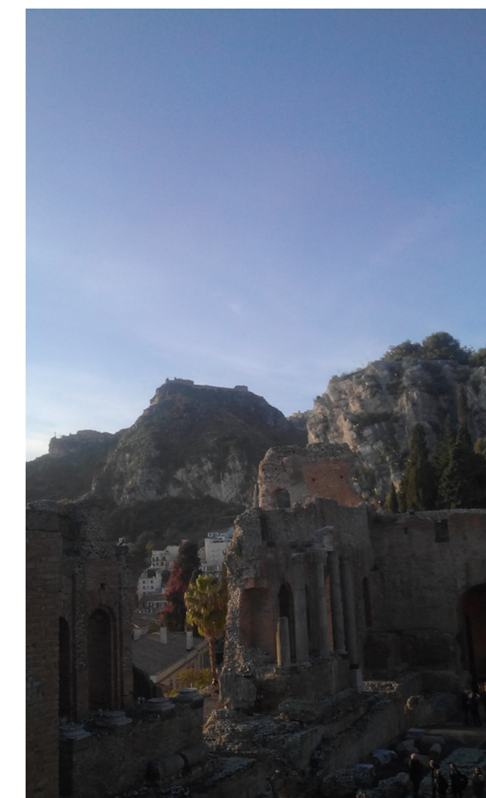
Teatro Antigo de Taormina