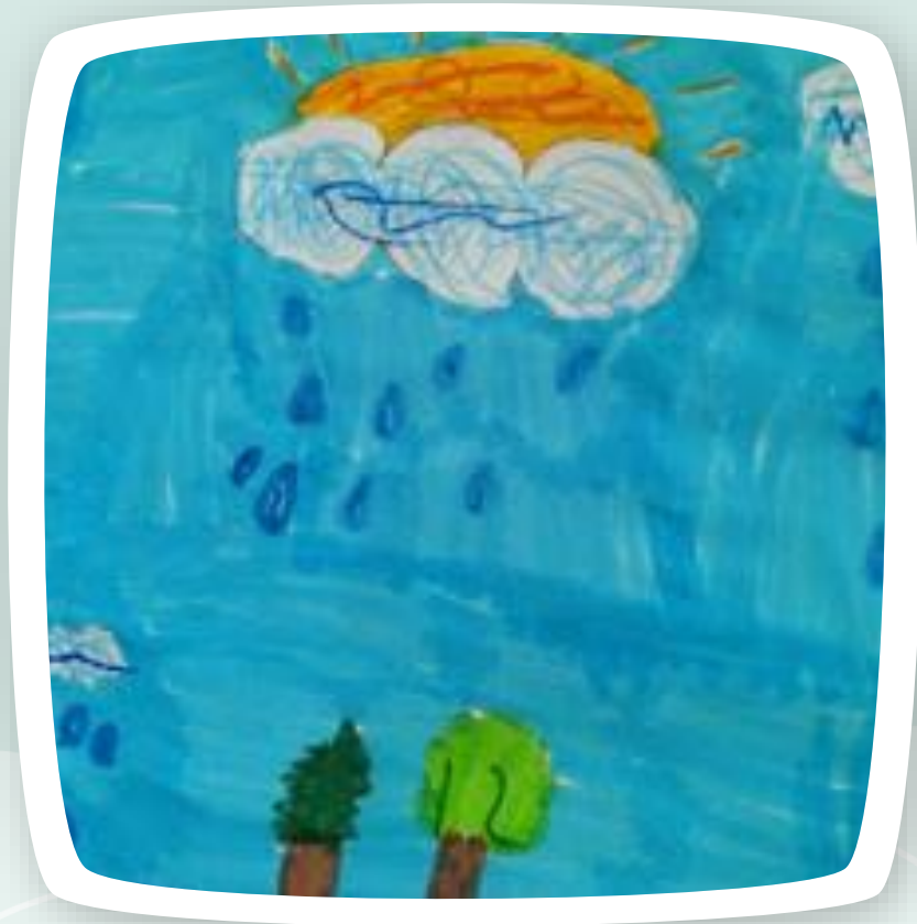
Il pianto delle nuvole che dà da bere all'assetata vegetazione.