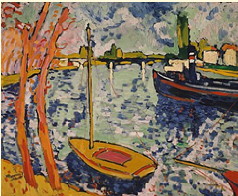
The River Seine, 1906.