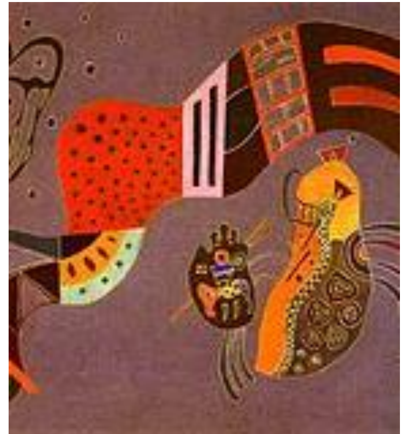
Tempered Elan, posljednja slika, 1944