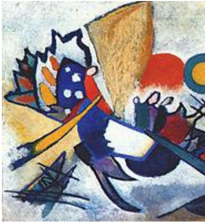
Improvisation 209, 1917.