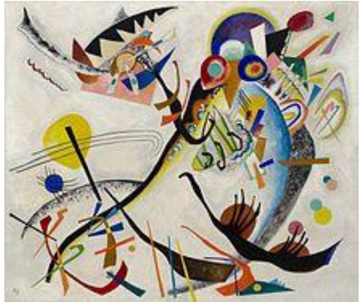
Blaues Segment, 1921.