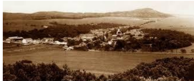
Pohľad na dnes už neexistujúcu dedinu Machovce.