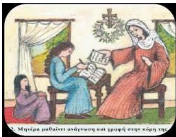
2. Μητέρα μαθαίνει ανάγνωση και γραφή στην κόρη της