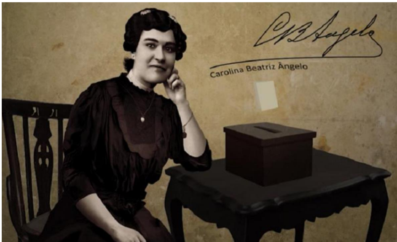
Carolina Beatriz Ângelo (1878 – 1911)