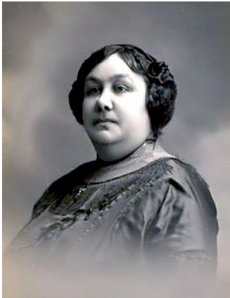
Adelaide Cabete (1867-1935)