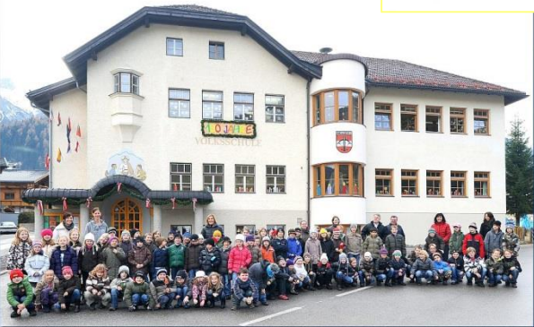
Volksschule Neder 2009/2010