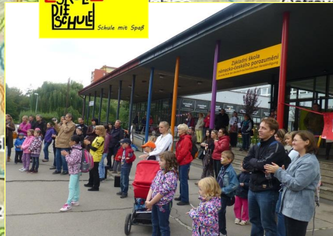
ZŠ německo-českého porozumění - Prag