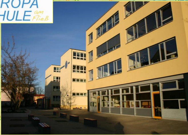
Europaschule am Fließ - Deutschland