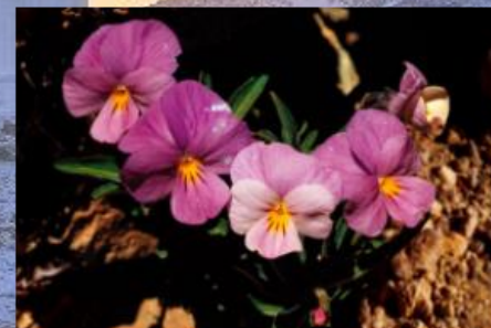
Violeta del Teide