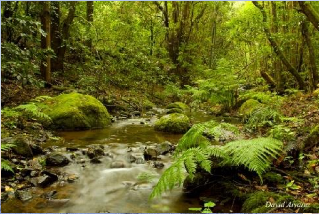
Garajonay (La Gomera)