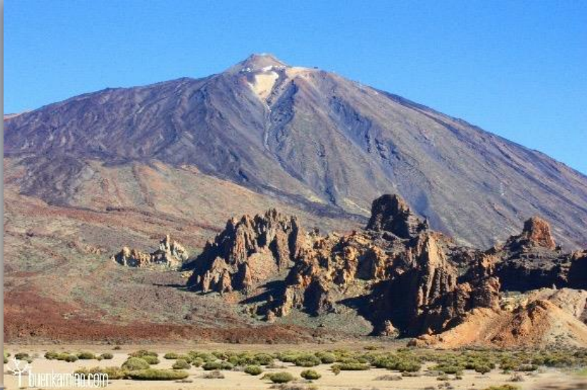
El Teide (Tenerife)