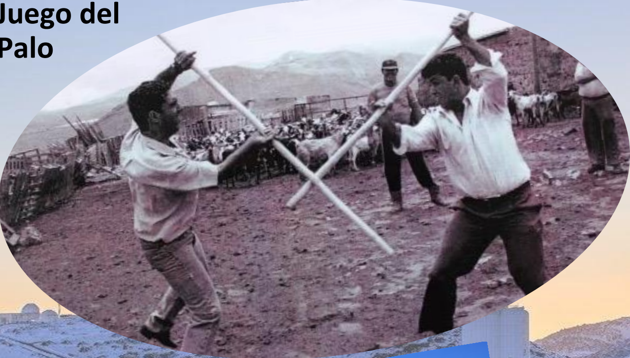
Juego del Palo