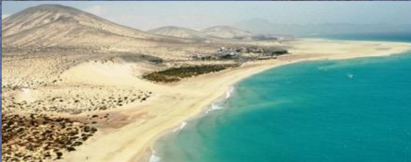
El Cotillo (Fuerteventura)