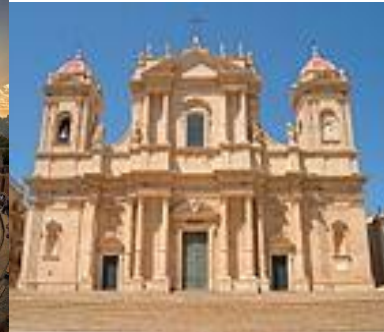
Späte Stadt Barock der Val di Noto