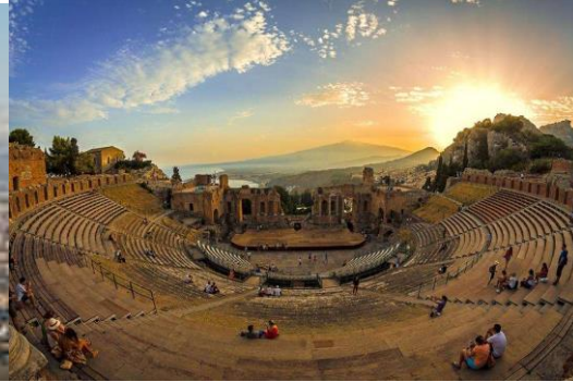
GRIECHISCHES THEATER VON TAORMINA