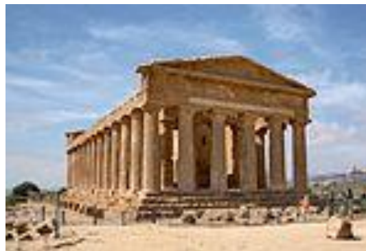
ARCHÄOLOGISCHER UND LANDSCHAFTSPARK DES TALS DER TEMPEL IN AGRIGENT