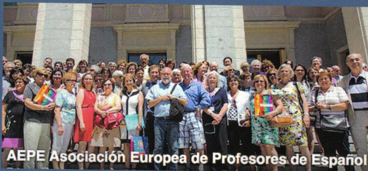
AEPE Asociación Europea de Profesores de Español