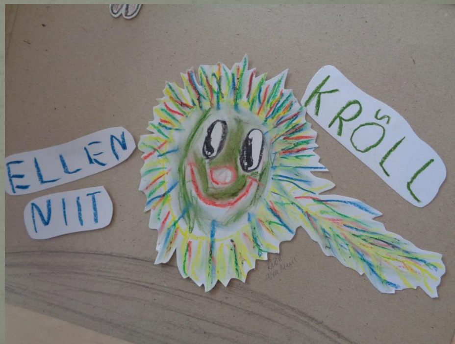
Pildi joonistas Eva Maria