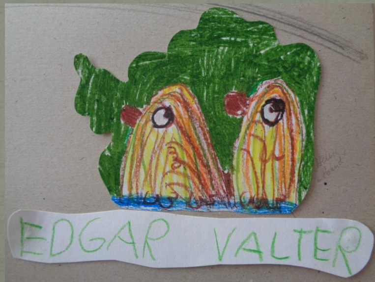
Pildi joonistas Heleri

Pokud on need, kes armastavad vett ja nad hoiavad oma varbaid vees. Nad on kollased ja karvased. Sisemuselt on nad paljad ja veidi häbelikud, nad kardavad inimesi.