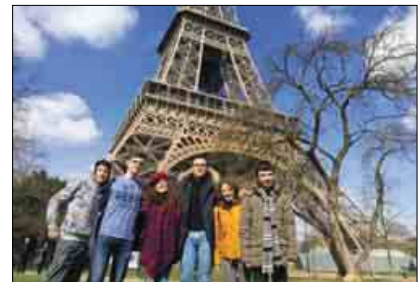
Il progetto europeo del da Vinci di Potenza

dal primo incontro con i docenti delle scuole partner, convenuti a Potenza nei mesi scorsi; e anche dalla prima settimana di mobilità, che si è svolta, a Segrè, nella Francia nord-occidentale, ed ha riunito gli studenti del Da Vinci, insieme ai loro colleghi portoghesi, spagnoli e francesi, nel liceo intitolato a Pascal della cittadina francese.