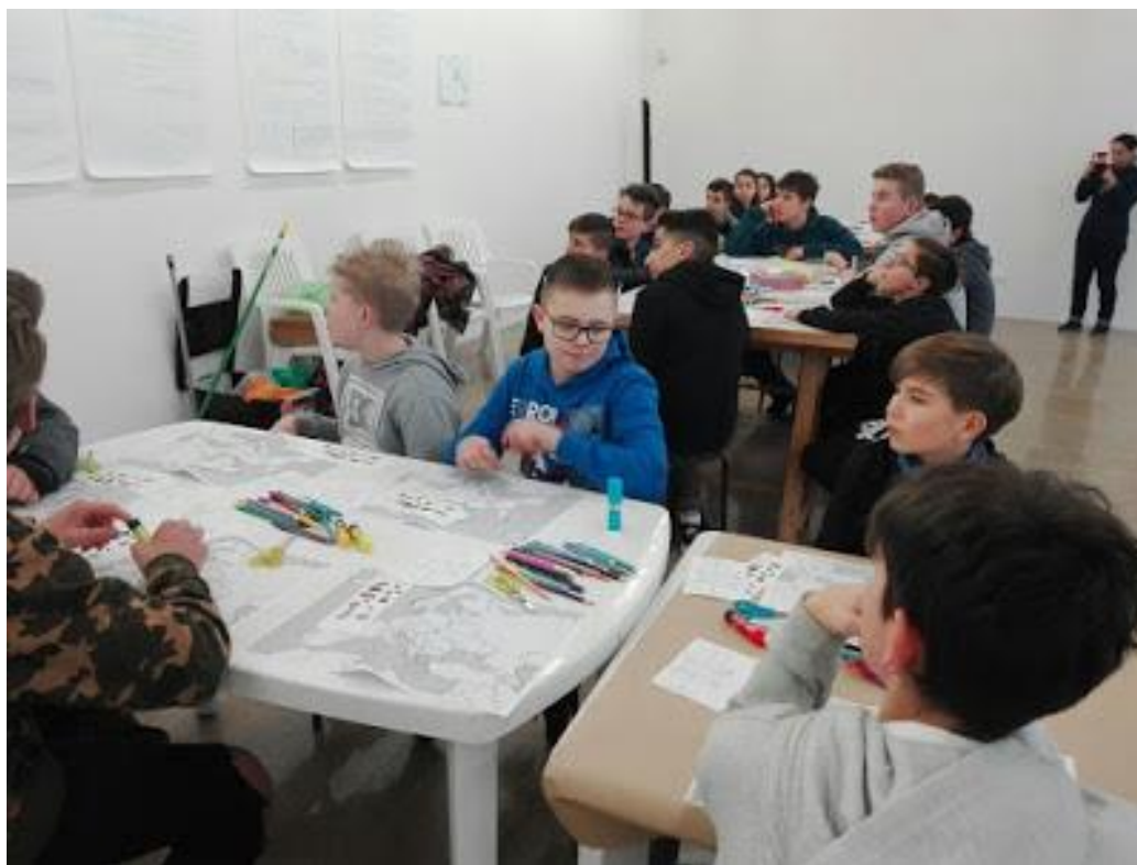
Udział w warsztatach

Pierwszego dnia pobytu we Włoszech uczniowie uczestniczyli w zajęciach integracyjnych, na których poznali metodę wytwarzania dźwięku własnym ciałem nazywaną "body percussion". Były to warsztaty prowadzone przez profesjonalnego muzyka. Następnie odbyło się uroczyste otwarcie z pokazem tańca ludowego, śpiewaniem pieśni ludowych przez dzieci z przedszkola oraz przedstawieniem każdego z uczestników. Ponad stu uczniów ze szkoły goszczącej zatańczyło do utworu "Dance, dance". Tego dnia również odbyła się wycieczka do muzeum sztuki antycznej w Quarto d'Altino, a więc w miejscowości, w której znajduje się szkoła goszcząca.