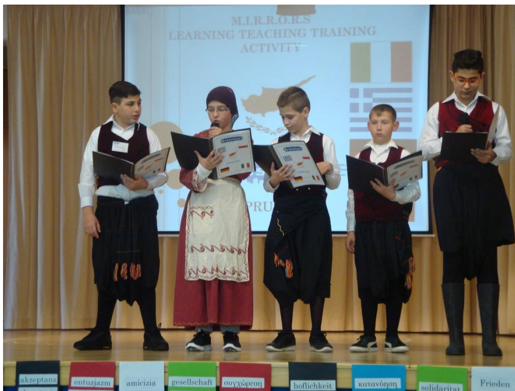
Typowe stroje cypryjskie