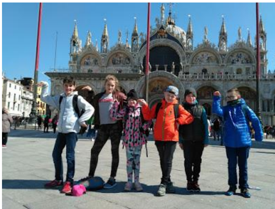
Nasze pożegnanie z Włochami