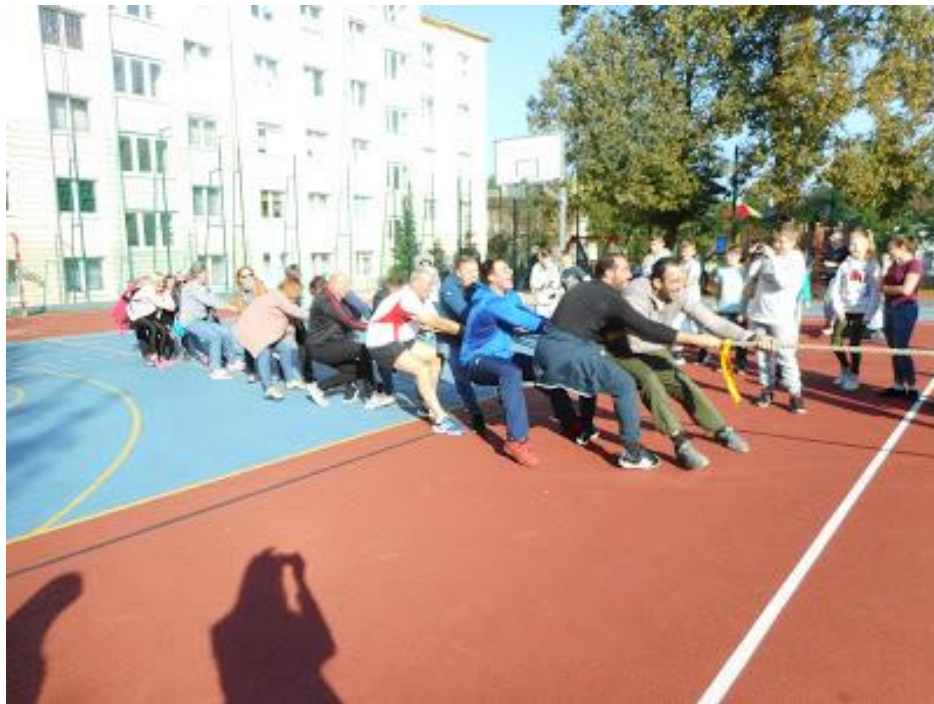
Przeciąganie liny – nauczyciele - uczniowie