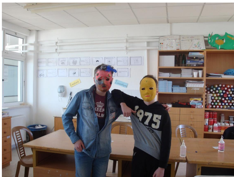
Nasze maski wykonane na zajęciach