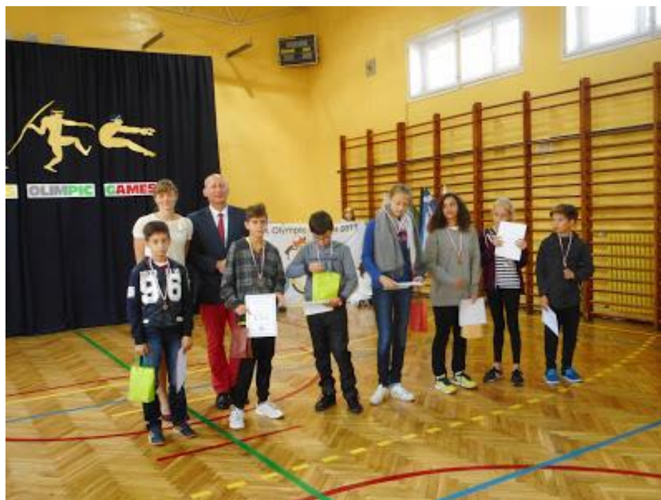
Uroczystość zamknięcia igrzysk