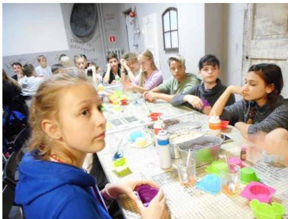
Warsztaty w Muzeum Mydła i Historii Brudu