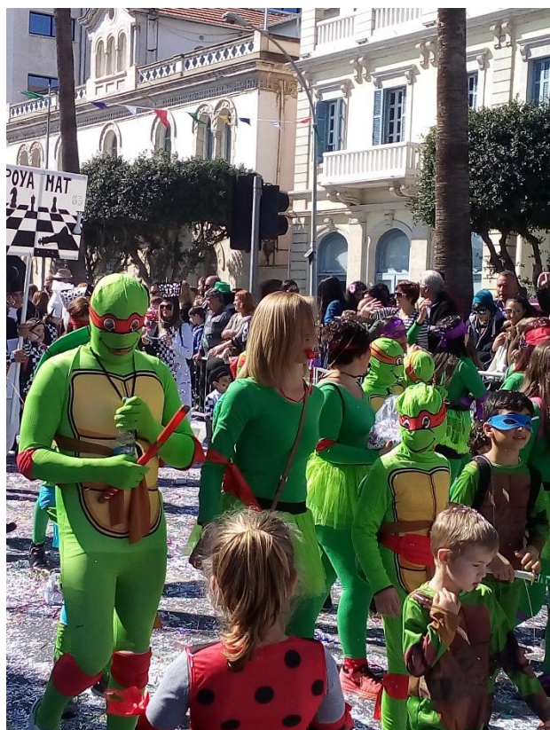
Karnawał w Limassol