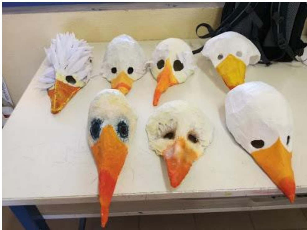
Prace uczniów ze szkoły goszczącej