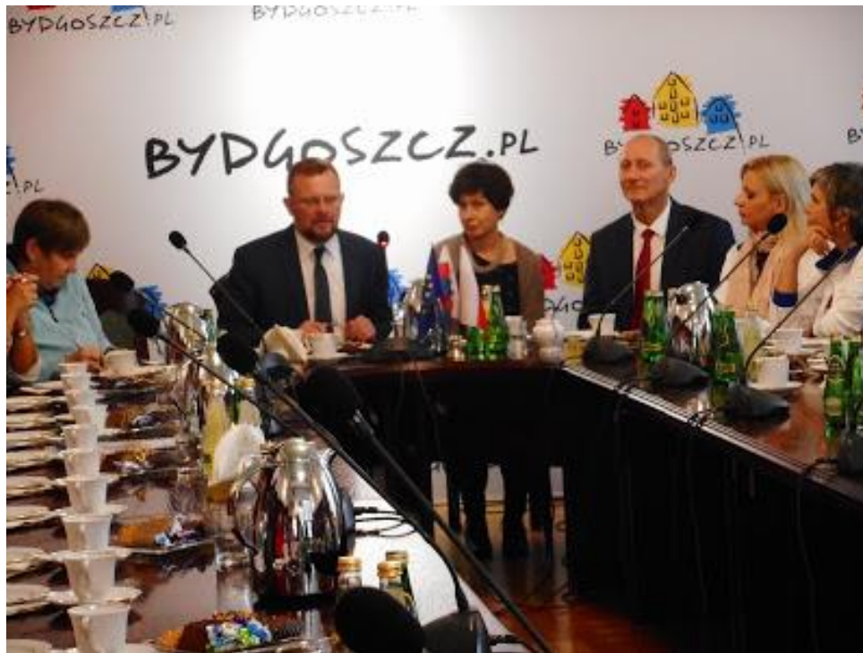
Wizyta w ratuszu