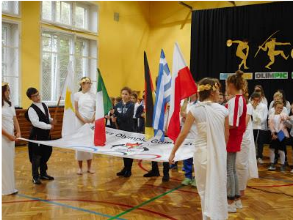
Ceremonia otwarcia igrzysk