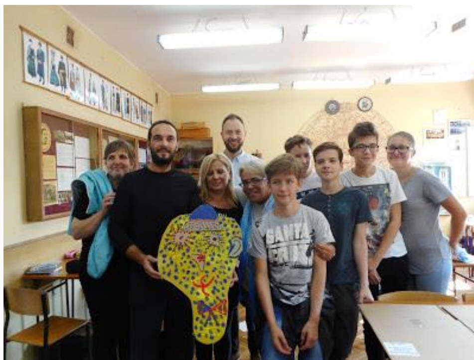
Maski przygotowane przez nauczycieli