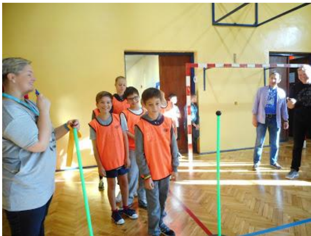
Zawody sportowe w szkole