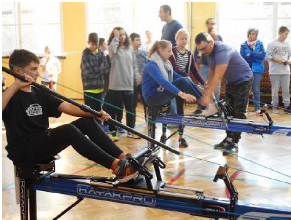
Wyścigi na ergometrach

Program pobytu zakończyliśmy wizytą w Muzeum Mydła i Historii Brudu, gdzie uczestniczyliśmy w warsztatach robienia mydła.