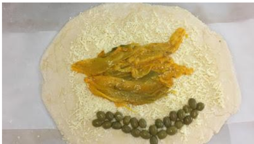
Flaga Cypru na zajęciach gotowania