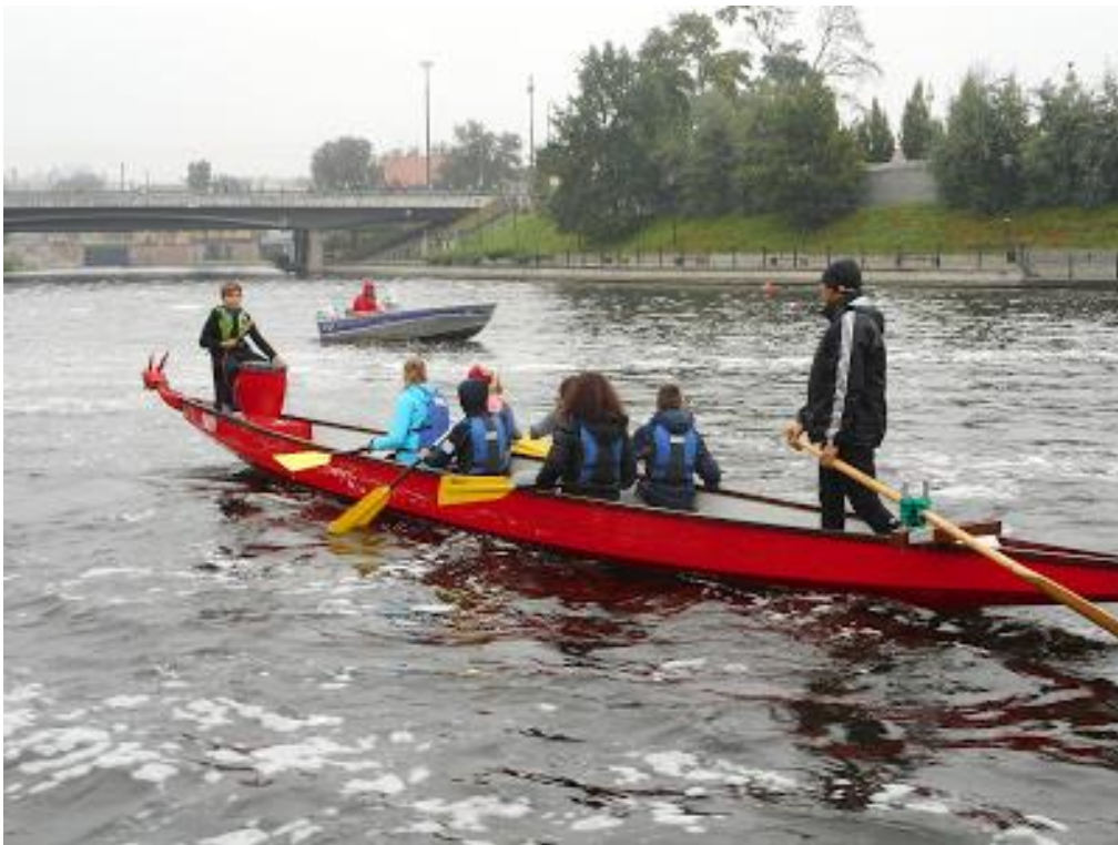
Wyścigi smoczycich łodzi