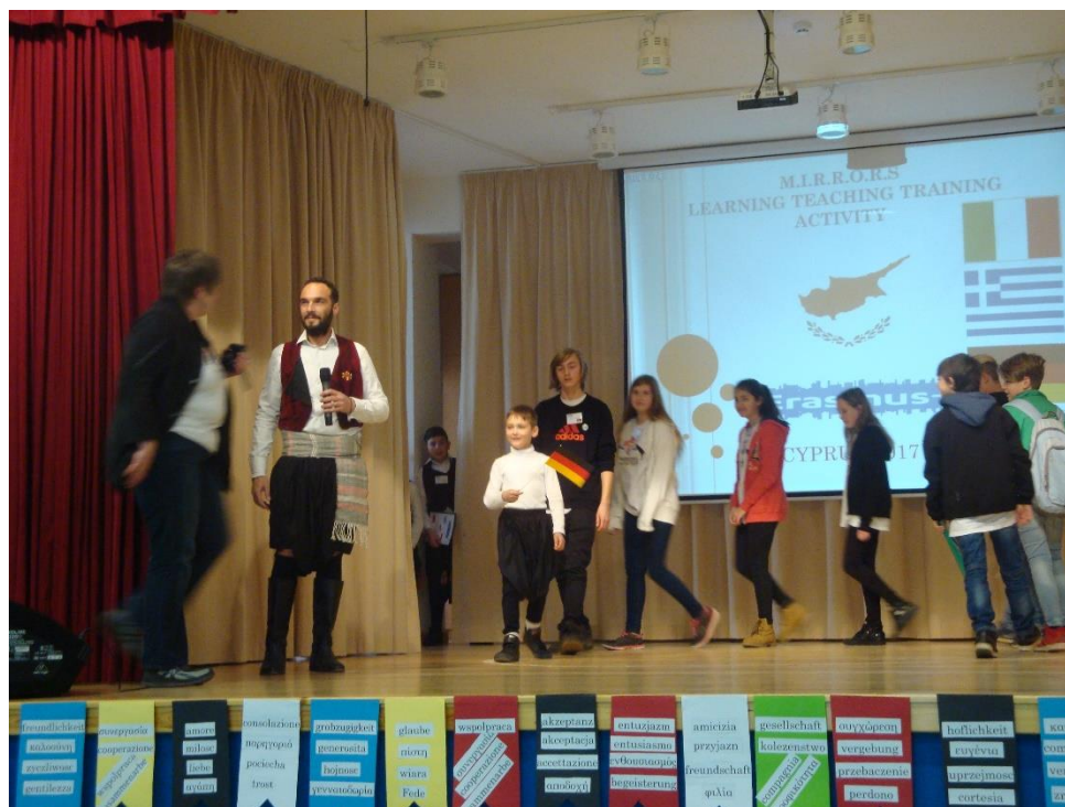
Powitanie w szkole

Szkołą partnerską w naszym projekcie była mała szkoła w wiosce Kalo Chorio niedaleko Limassol. Podczas całego pobytu uczniowie byli zakwaterowani w domach naszych gości – rodziców uczniów. Mieli więc możliwość nie tylko ćwiczyć język, ale i poznać realia życia codziennego w innym kraju. Niektóre dni spędzili w szkole biorąc udział w warsztatach artystycznych oraz innych zajęciach prowadzonych z wykorzystaniem techniki teatru forum. Ciekawym urozmaiceniem był udział w karnawale w Limassol oraz wycieczka do Pafos – miasta położonego na wybrzeżu i znanego z tego iż właśnie tu z morskiej piany narodziła się Afrodyta. Szóstego i ostatniego dnia naszego pobytu na Cyprze musieliśmy pożegnać się z tym przepięknym i zarazem tajemniczym krajem snując plany na przyszłość i mając nadzieję na kolejne spotkanie z nowo poznanymi kolegami.