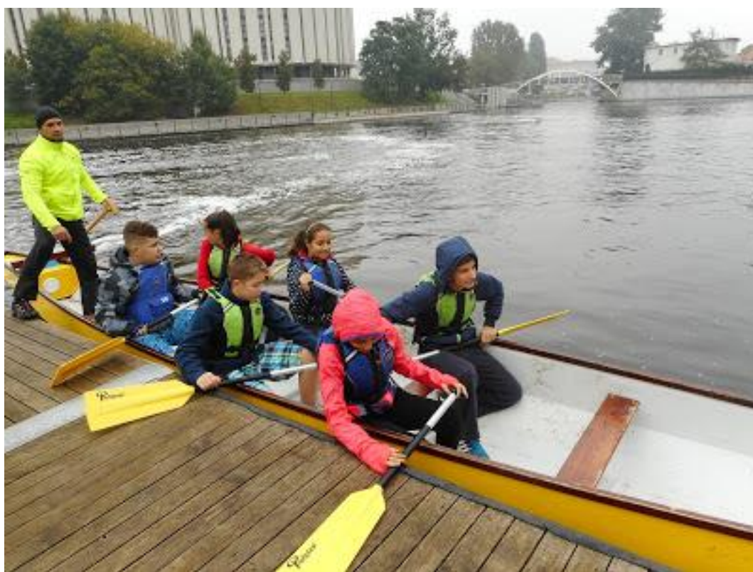
Zawody na Marinie

Drugi dzień pobytu naszych gości upłynął pod hasłem zawodów sportowych na Marinie. Było bardzo ciekawie, zabawnie, ale też i zimno, niestety!!! Zawody obejmowały wyścigi smoczych łodzi na dystansie 150m, pięciu zespołów po 7 zawodników. Zajęło to nam więc całe przedpołudnie. Po obiedzie natomiast część grupy wróciła na Marinę, aby popłynąć w rejs Ondyną, a pozostali uczestniczyli w zajęciach z tworzenia bloga oraz rozwiązywali quiz o Bydgoszczy. W ten sposób założyliśmy własny blog, na którym opisaliśmy pierwsze wrażenia z pobytu w Polsce i Bydgoszczy.