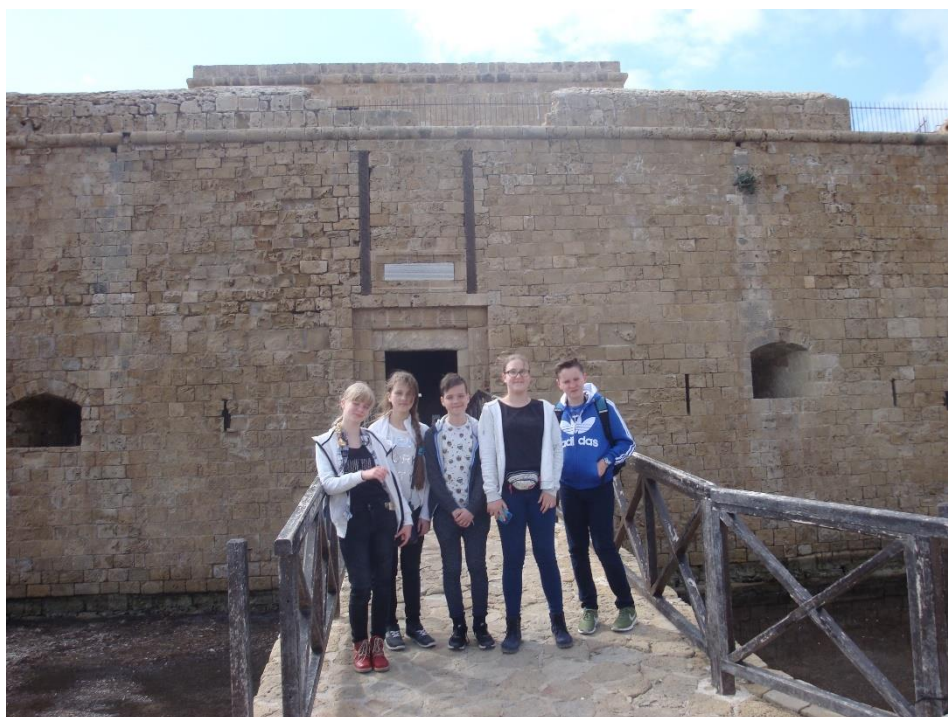
Wycieczka do Pafos