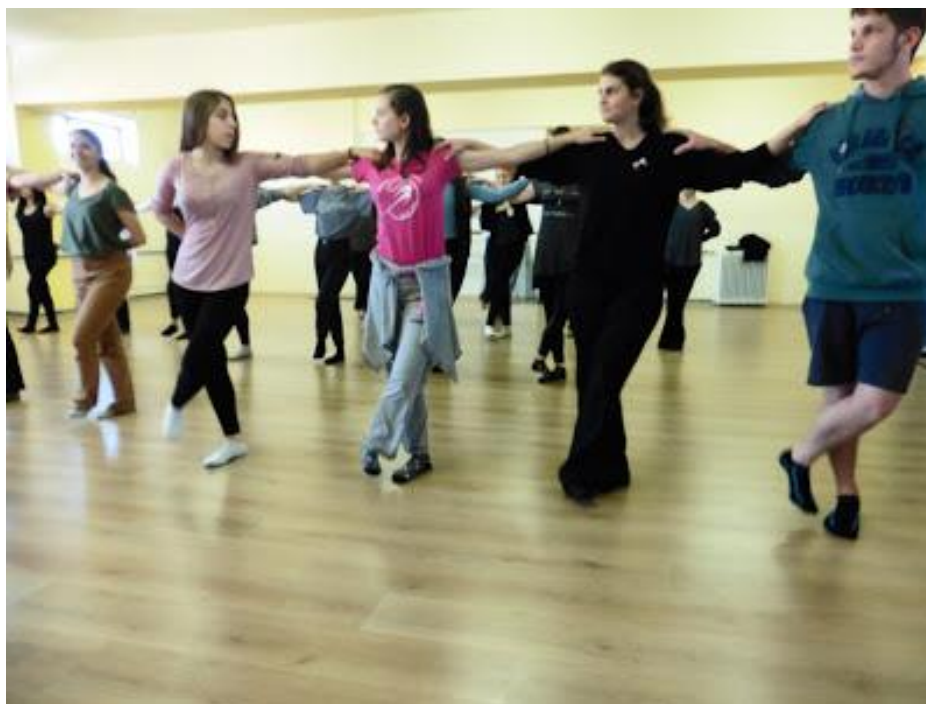
Syrtaki – taniec grecki