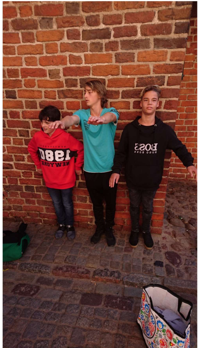
Nel pomeriggio abbiamo visitato il Museo delle leggende...