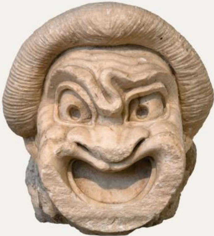
Μαρμάρινο θεατρικό προσωπίο στον τύπο του πρώτου δούλου (ηγεμών θεράπων) της Νέας Κωμωδίας. 2ος αι. π.Χ. Εθνικό Αρχαιολογικό Μουσείο

Στα αρχαία ελληνικά η λέξη προσωπίον ή προσωπίς ή προσώπιον ή πρόσωπον