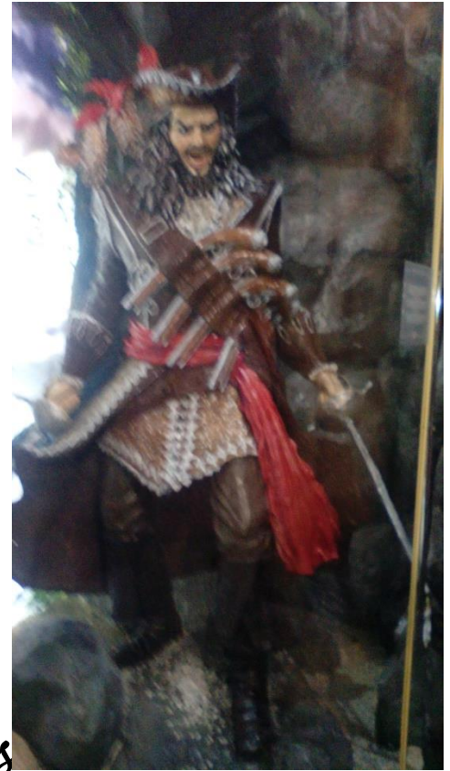
Pirata das Caraibas