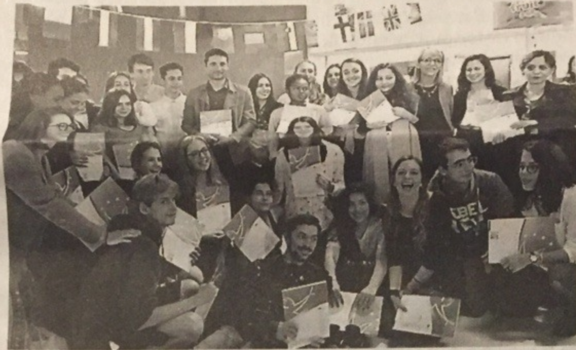
Les 120 lycéens réunis au lycée Berthelot.

« Je vais peut-être faire exprès de louper mon bac pour continuer le projet l'année prochaine ! »