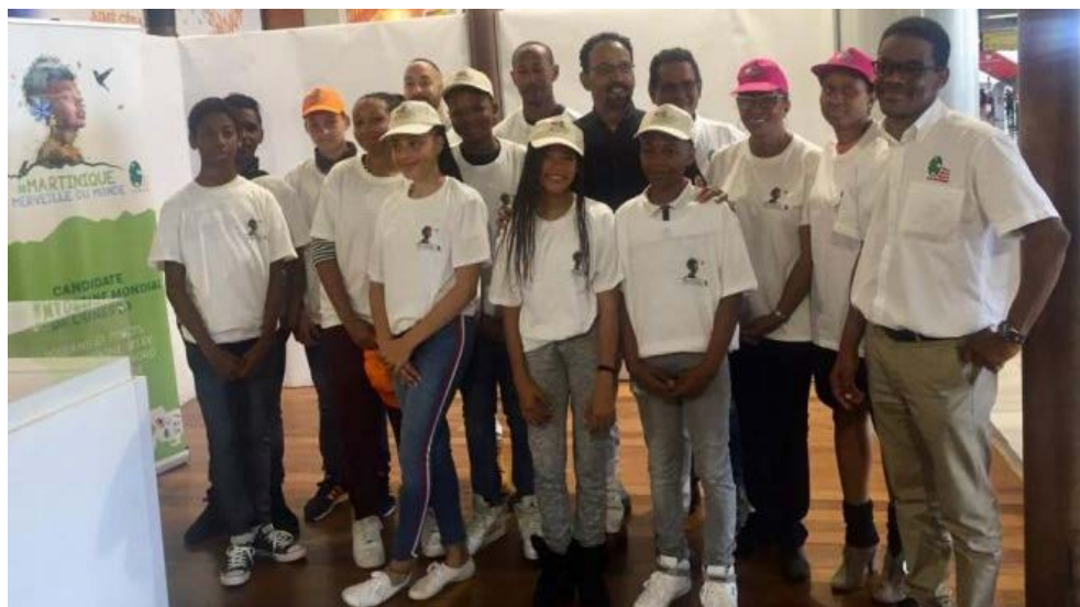
La délégation de Martinique à son départ mardi 2 avril à l'aéroport Aimé Césaire

Dix élèves du collège Edouard Glissant du Lamentin se sont envolés hier (mardi 2 avril 2019) à 17h45 pour le parlement européen. Ils présenteront la candidature de la Martinique " des Volcans et Forêts de la Montagne Pelée et des pitons du nord " au Patrimoine Mondial de l'UNESCO pour l'année 2020.