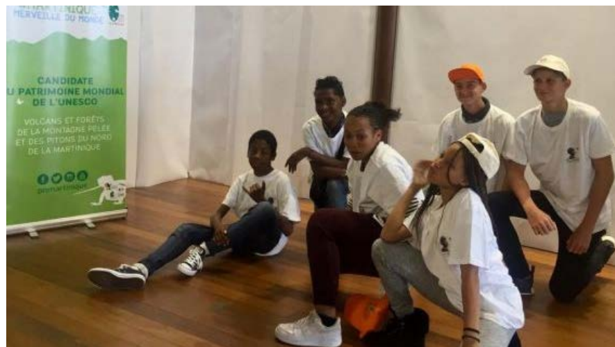
Les jeunes devant les affiches de communication sur la candidature de la Martinique

Le collège Edouard Glissant a remporté en 2016, un prix junior au défi académique UNESCO. Plusieurs jeunes de la délégation ont déjà travaillé sur la thématique du développement durable, et ils avaient été invités à imaginer et produire un dossier mettant en valeur le caractère exceptionnel et irremplaçable d'un site de Martinique. Ils sont des porte-drapeaux de la Martinique.