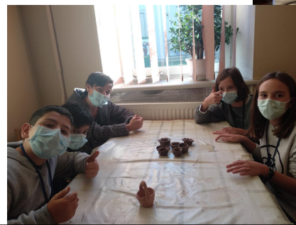
Talleres en el centro de arte tradicional