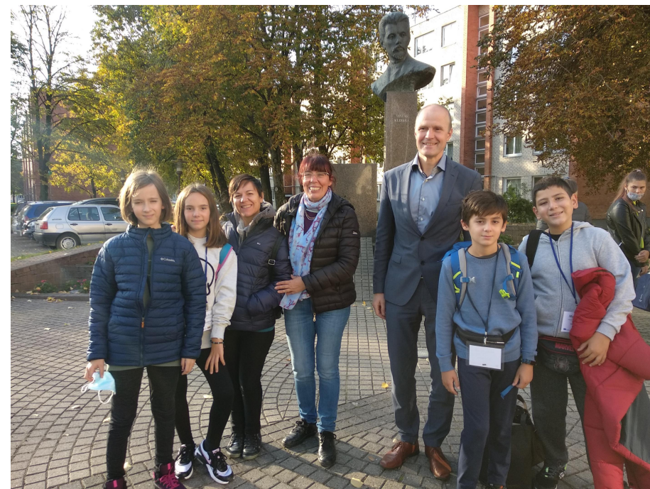
Con el alcalde de Vilkaviskis