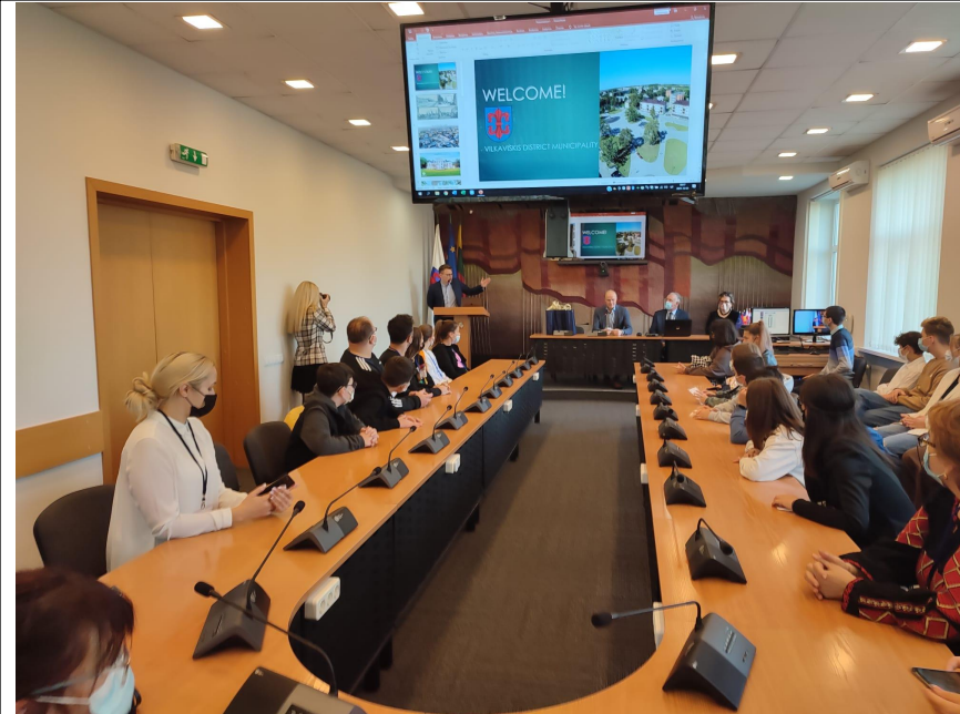
Recepción en el ayuntamiento