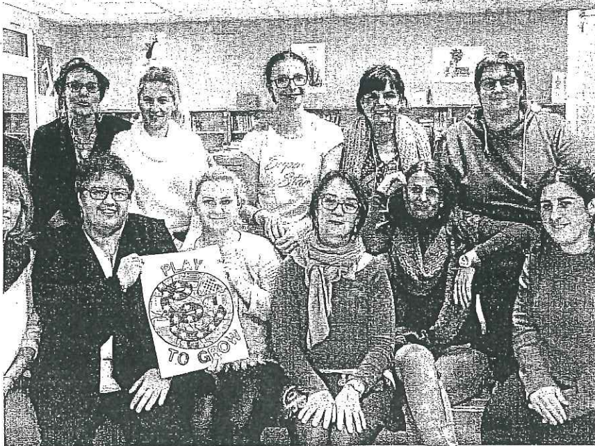
A Aulnay, présentation par les enseignantes françaises, grecques et polonaises du logo imaginé par les élèves.