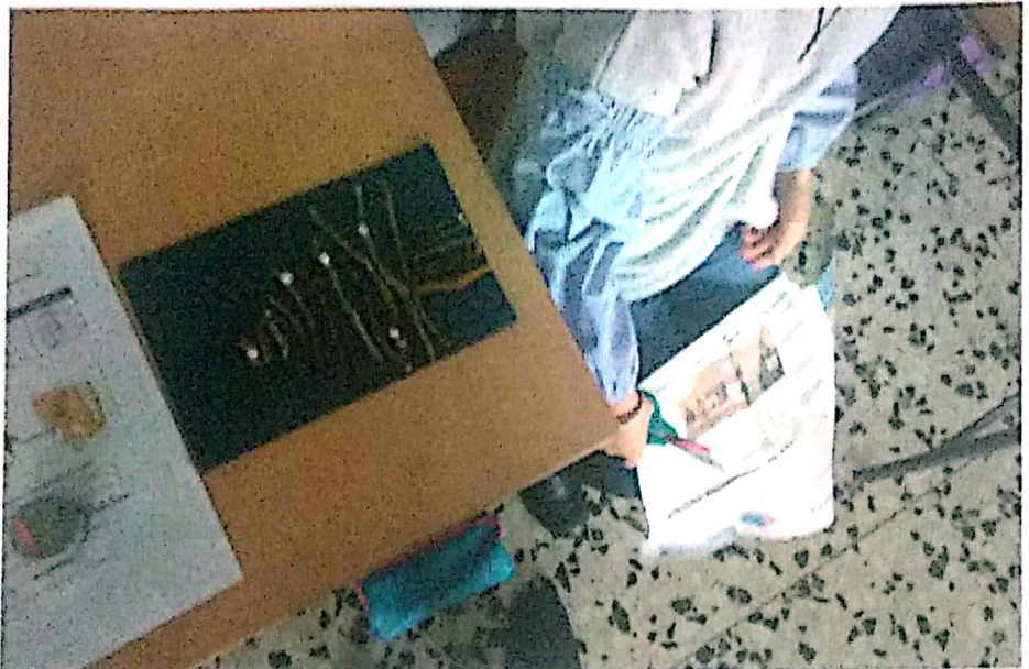
En Navidad trabajamos nuestras tradiciones navideñas e intercambiamos postales.