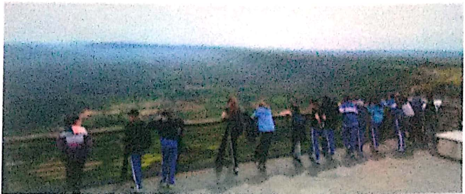
El patrimonio cultural también incluye el patrimonio natural sobre el que aprendimos durante el intercambio