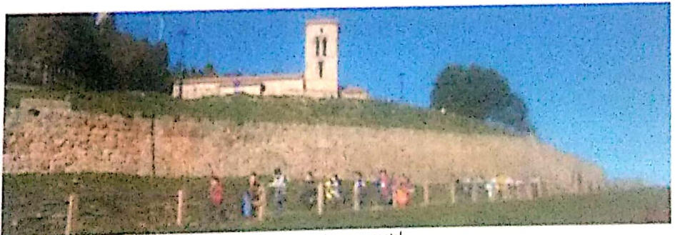
Los alumnos trabajaron el patrimonio artístico mediante una ruta monumental.

ción que supone el trabajo por proyectos y las tareas concretas de este proyecto eTwinning.