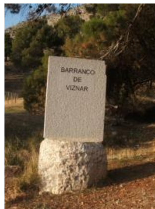
Fosa donde posiblemente este enterrando Federico García Lorca.

Primera colección de notas de tituladas “Impresiones y Paisajes”.