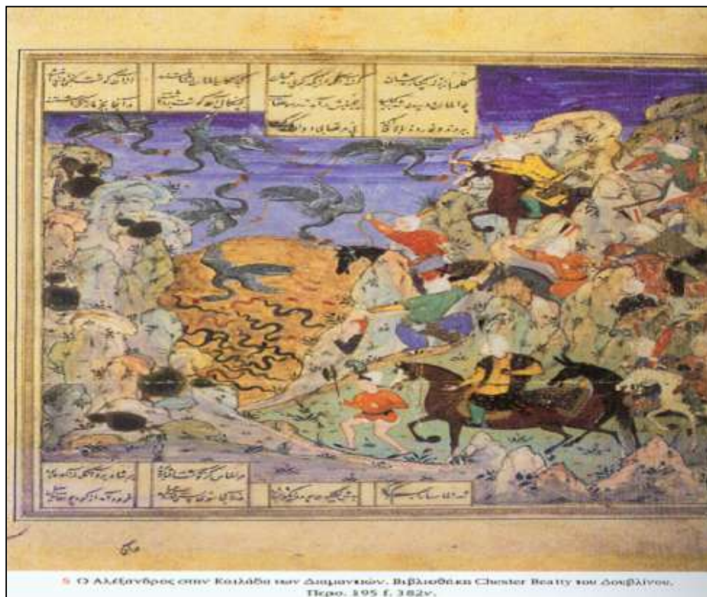
• Ο Αλέξανδρος στην Κοιλάδα των Διαμαντιών. Βιβλιοθήκη Chester Beatty του Δουβλίνου, Περιο. 195 f. 382v.

Κανείς άλλος δεν έφτασε στην περιοχή που γινότανε παραγωγή των διαμαντιών, εκτός του Μεγάλου Αλεξάνδρου. Αυτή η κοιλάδα συνδέεται με την κοιλάδα Hind. Με μια ματιά δεν μπορείς να καταλάβεις το τεράστιο μέγεθος και βάθος της, όπου υπήρχαν φίδια που κανείς άνθρωπος δεν είχε δει ξανά και που αν κάποιος τα κοίταζε, πέθαινε. Παρ' όλα αυτά, αυτή η δύναμη παρέμενε στα φίδια, όσο ζούσανε, ενώ όταν πέθαιναν αυτή χανόταν. Έτσι, ο Αλέξανδρος διέταξε να τοποθετηθεί ένας μεγάλος σιδερένιος καθρέφτης σε εκείνο το μέρος, όπου βρισκόταν τα φίδια. Καθώς τα φίδια πλησίαζαν, η ματιά τους έπεφτε πάνω στην ίδια την μορφή τους μέσω του καθρέφτη και πέθαιναν. Τότε, λοιπόν, ο Αλέξανδρος θέλησε να πάει να πάρει διαμάντια από την κοιλάδα, αλλά κανείς δεν τολμούσε να πάει μαζί του. Ζήτησε συμβουλή από τους σοφούς γέροντες και του είπαν να ρίξει ένα κομμάτι κρέας στην κοιλάδα. Αυτό και έκανε, και τα διαμάντια προσκολλήθηκαν στο κρέας και τα πουλιά από τον ουρανό τράβηξαν το κρέας έξω από την κοιλάδα. Τότε ο Αλέξανδρος διέταξε να κυνηγήσουν τα πουλιά και να πιάσουν ότι πέσει από το κρέας. Η προσκόλληση των διαμαντιών στο κρέας έχει συνδεθεί με την ιδιότητα των διαμαντιών να κολλάνε σε λίπος και επιβεβαιώνει ότι αυτά τα πετράδια ήταν όντως διαμάντια.