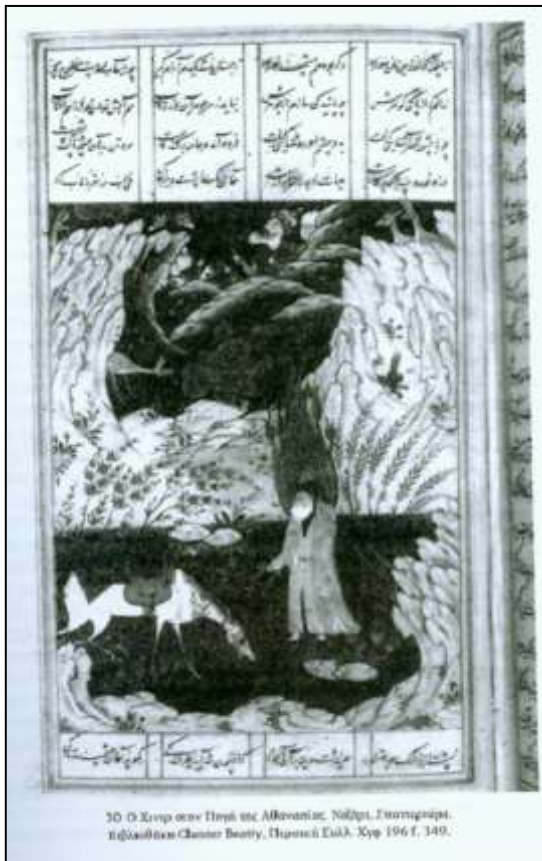
30 Ο Χένρι στον Πηγάδι της Αθανασίας. Νόημα, Γουιντενβέργκερ. Εθνικό Αρχείο Chester Beatty, Παιδική Ευλογία, Σελ. 196 f. 349.

Ο σύντροφος του Αλέξανδρου βρήκε το Πηγάδι της Ζωής τυχαία, όταν ένα αποξηραμένο ψάρι το οποίο μούλιαζε μέσα σε αυτήν ξαφνικά ζωντάνεψε και κολύπησε μακριά. Έκανε μπάνιο στην πηγή και μετά έτρεξε να πει στον κύριο του τι είχε συμβεί. Και οι δυο άντρες επέστρεψαν, αλλά δεν κατάφεραν να βρουν τη μαγική πηγή ξανά. Ο μάγισσας έγινε αθάνατος και ο Αλέξανδρος έπρεπε να πεθάνει.