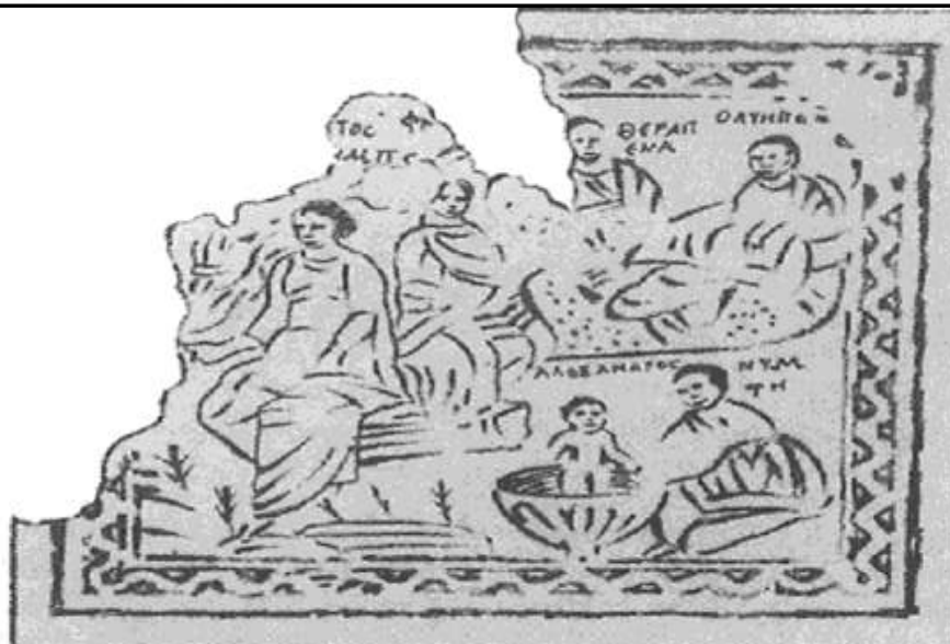
3 Η γέννηση του Αλεξάνδρου όπως απεικονίζεται σε ένα μωσαϊκό από το Σουεντιέ, στον Λίβανο. Ζωγραφική από τη φωτογραφία που δημοσιεύθηκε από τον Chéhab το 1957.