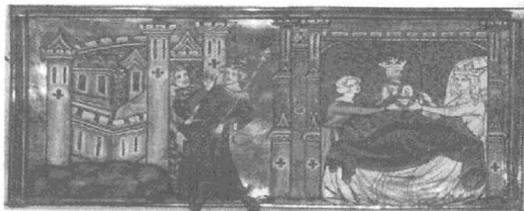
2 Η γέννηση του Αλεξάνδρου. Από το Ιωάννης ο Καλός, Miroir des histoires , περ. 1345. Λέιντεν: χγφ Voss 44F.3a. f. 157v.