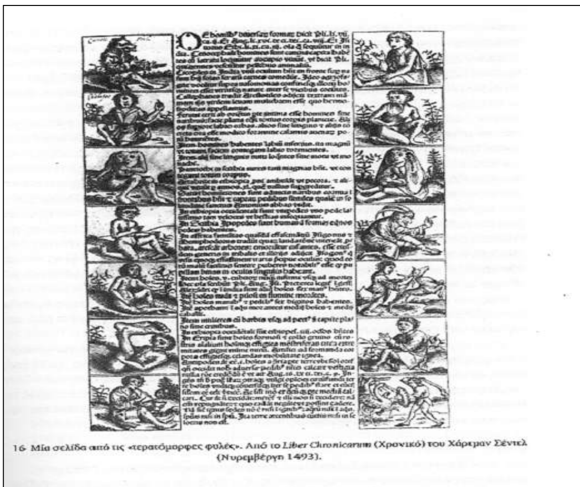
16 Μία σελίδα από τις «τερατόμορφες φυλές». Από το Liber Chronicarum (Χρονικό) του Χάρτμαν Σέντελ (Νυρεμβέργη 1493).

Μια παρόμοια εκδοχή του θρύλου μιλά για τον εγκλεισμό των Κυνοκέφαλων από τον Αλέξανδρο στα Τάρταρα.