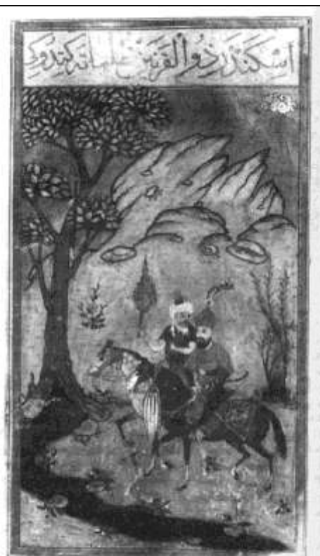
39 Ο Αλέξανδρος και ο Χένρι στη Σάρα του Εδέσους. Από ένα παλαιό κειμήλιο. «Πράγμα και Αποκατάσταση και Μαντικές. Εθνικό Αρχείο Pierpont Morgan, Νέα Υόρκη, Σελ. 700 f. 79