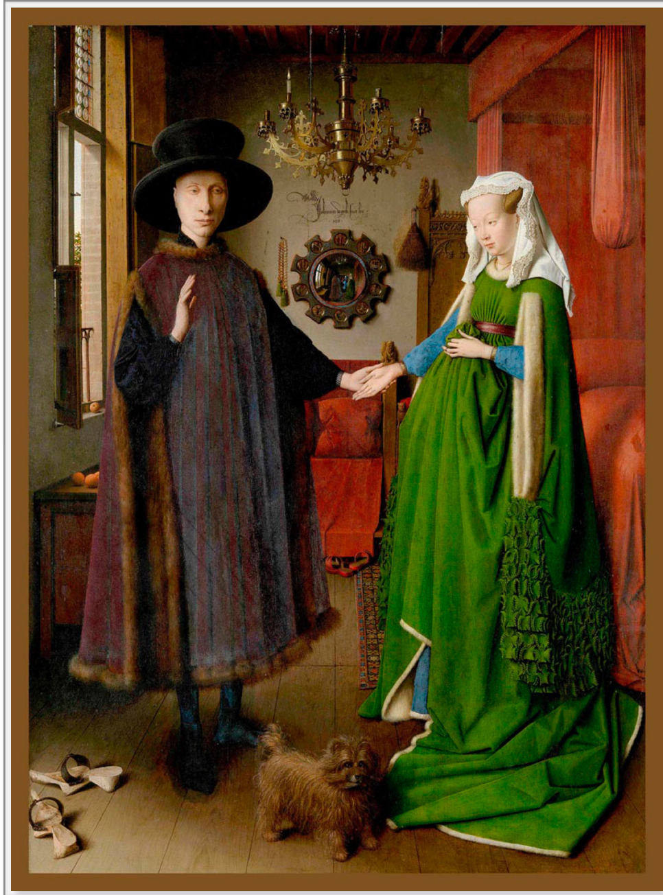
El matrimonio Arnolfini. Jan Van Eyck, 1434 Óleo sobre tabla (82 x 60 cm)