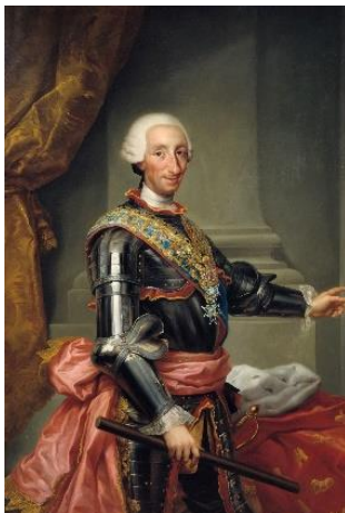
ANTÓN RAFAEL MENGES 1728-1779

Retrato de Carlos III (4.01), hacia 1774.