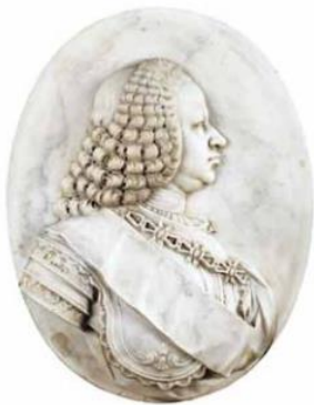
GIOVAN DOMENICO OLIVIERI