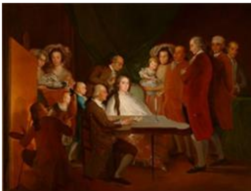
FRANCISCO DE GOYA