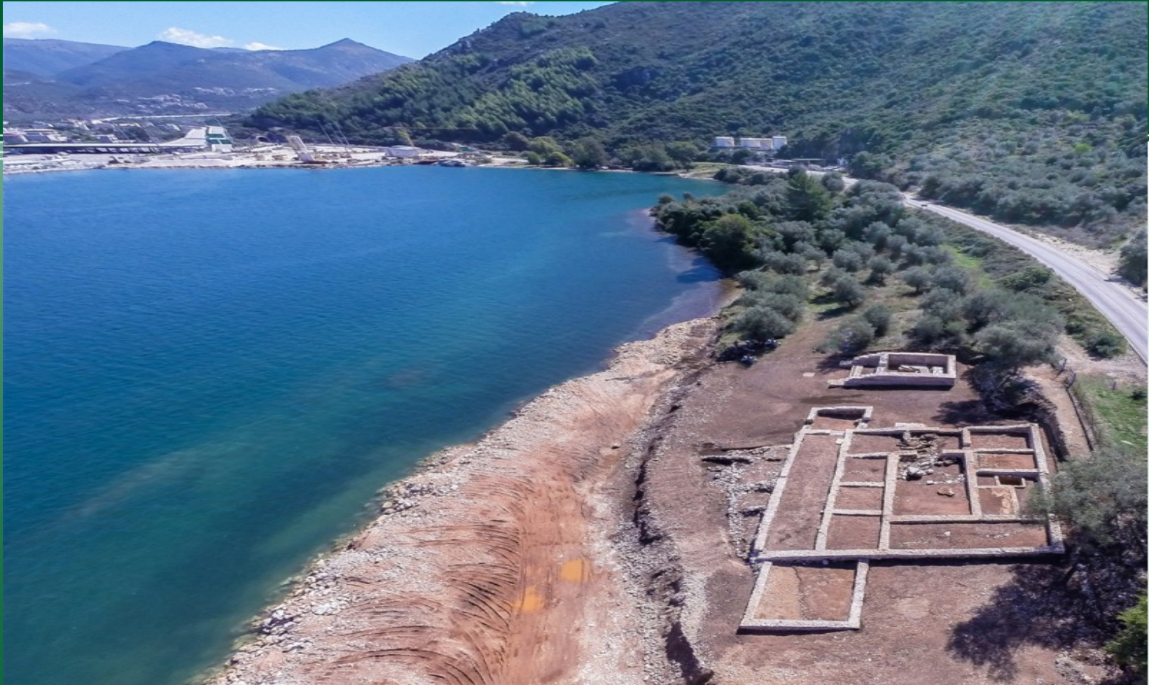
Γενική άποψη της θέσης