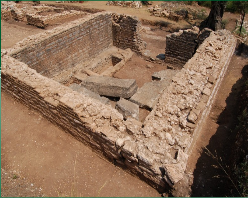
Ο ταφικός θάλαμος