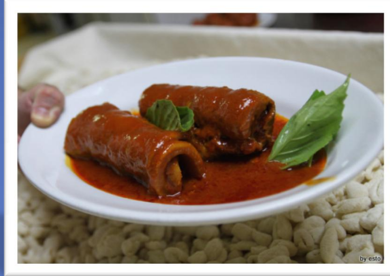
viande au ragù