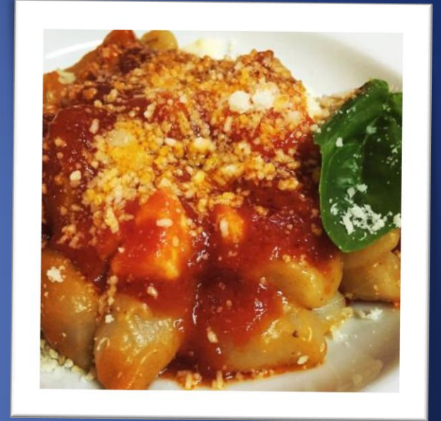
Gnocchi au ragù

alla Gnoccolata est un restaurant où l'on peut déguster les plats typiques de la tradition gastronomique napolitaine.