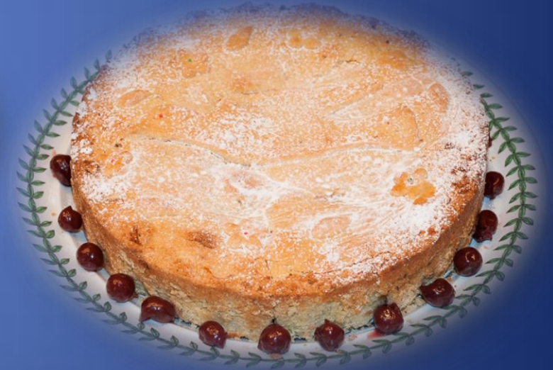
Torta di tagliolini