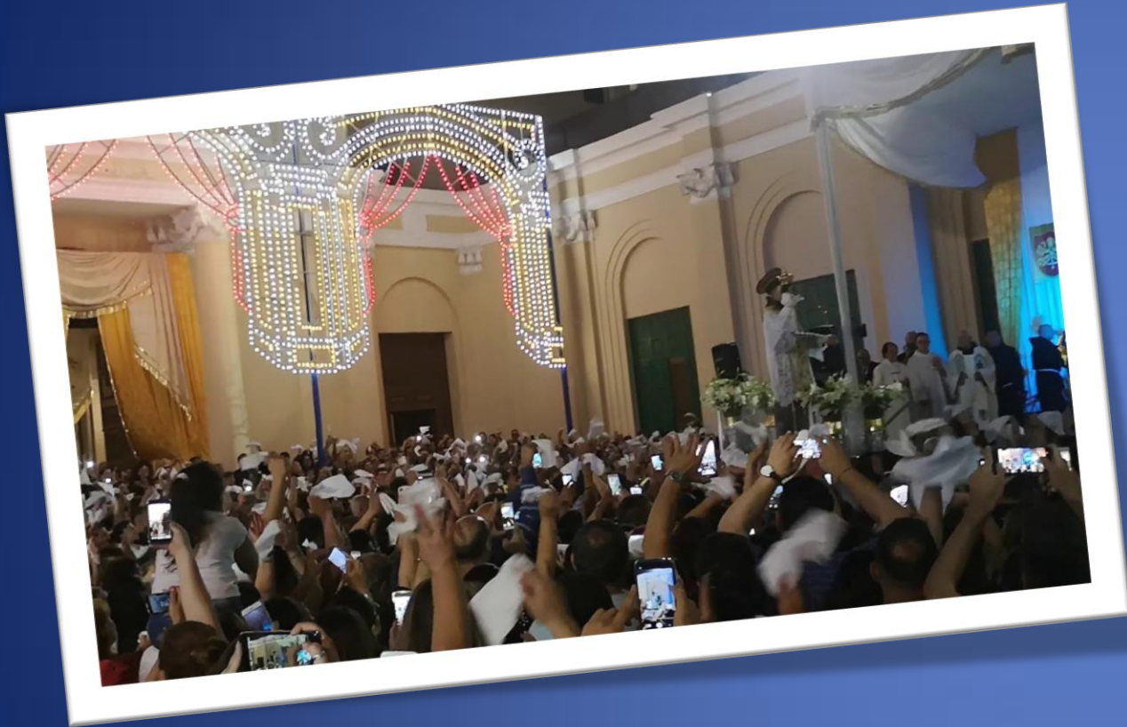
Fête de Saint Antoine de Padoue(13 juin).