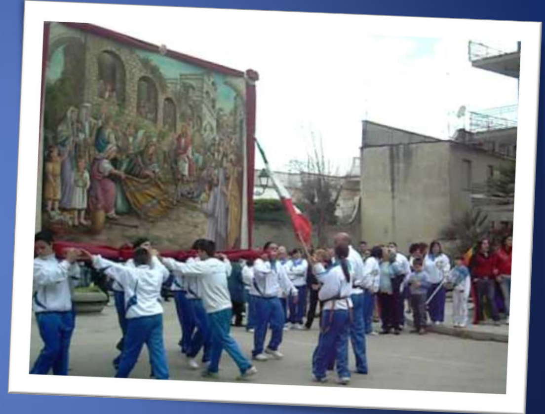
Fête des Fujenti (25 avril)