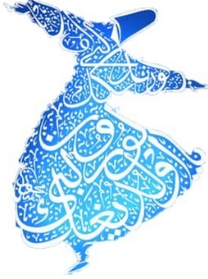
Mevlana Gibi Projesi

1. Mevlana'nın babası Bahaeddin Veled hangi unvan ile anılmıştır?